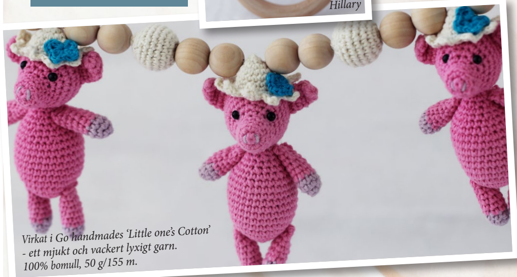
Virkat i Go handmades 'Little one's Cotton' - ett mjukt och vackert lyxigt garn. 100% bomull, 50 g/155 m.

Go handmade quality design in a unique style