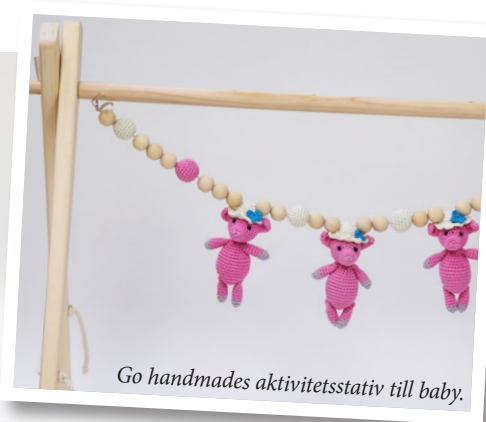
Go handmades aktivitetsstativ till baby.