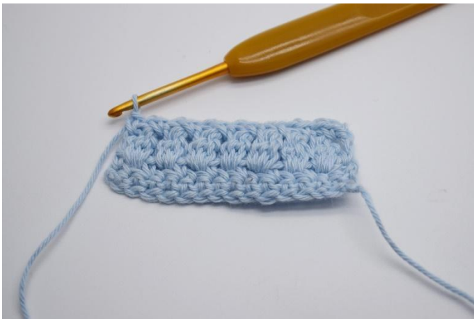
15. Upprepa varvet ut och avsluta med 1 fm i vändmaskan. Upprepa varven tills du har den önskade storleken på din tvätzlapp. Gör eventuellt en kant med fm.