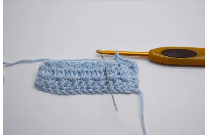
14. Gör 1 lm, virka 1 fm i nästa lm-mellemrum.