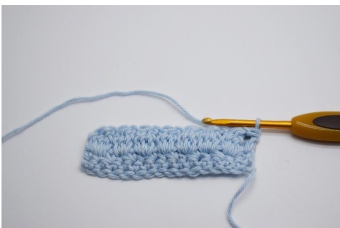
11. Vänd arbetet med 1 lm.