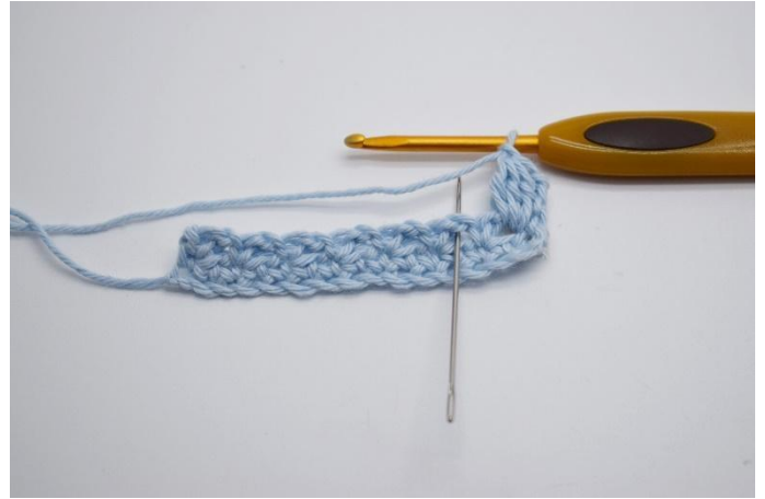
8. Nästa stolpgrupp virkas i nästa lm-hål på föregående rad.