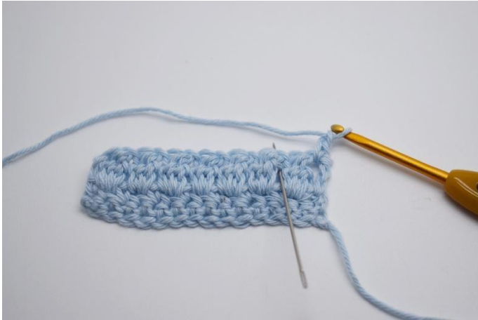
13. Gör 1 lm, virka 1 fm i lm-mellanrummet från förr varvet mellan stolpgrupperna