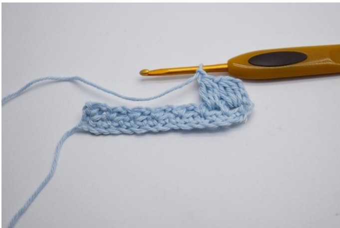
9. Gör 1 lm.