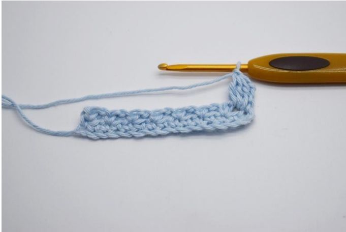
7. Gör 1 lm.