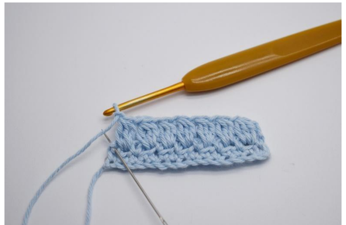
10. Upprepa med stolpgrupper i alla lm-hålen på föregående varv, varvet ut. I vändmaskan virkas 1 hst.