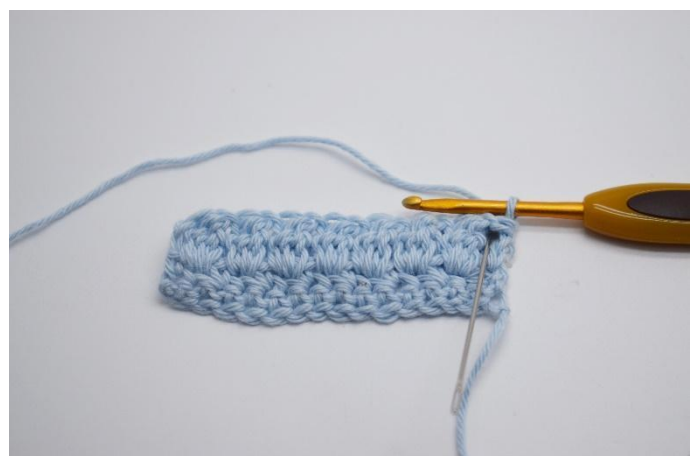
12. Virka 1 fm i första maskan.