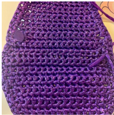
Avigsida på projektet

Varv 1: Virka fastmaskor i alla maskor. 1 luftmaska, vänd.