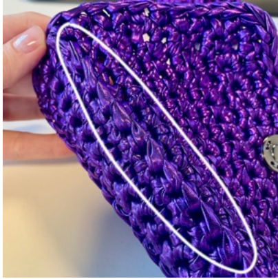
Rätsida på projektet.