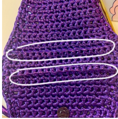
Rätsida på projektet.