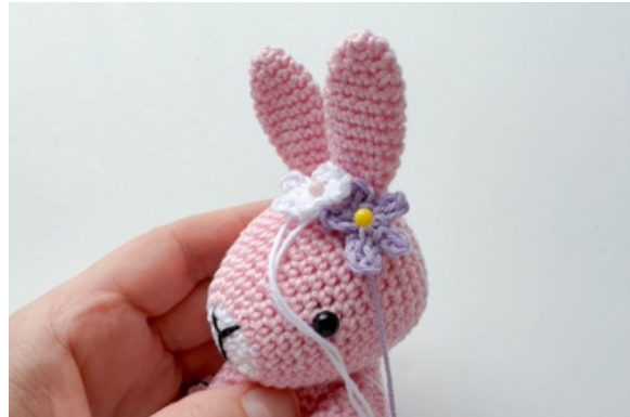
22. Placera blommorna överst på huvudet