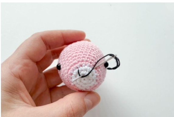
11. För upp stoppnålen 2 varv längre ner