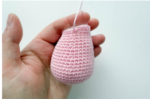
8. Kropp, lämna en garnände till att sy med