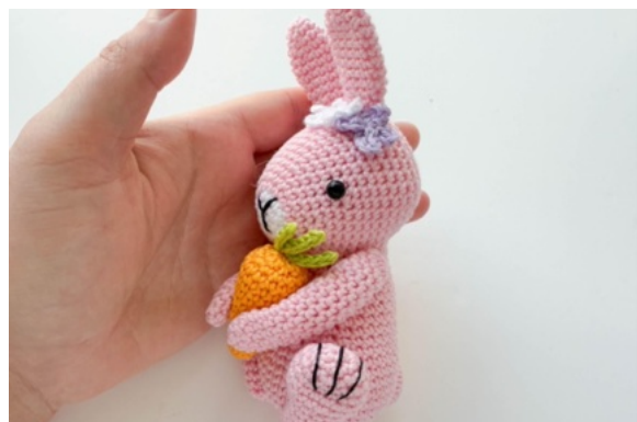
24. Färdig hare