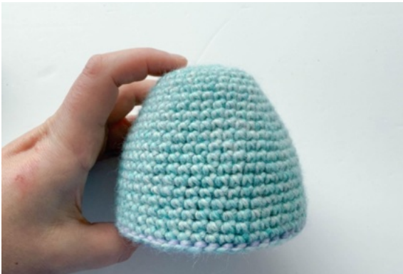
33. Äggets övre del