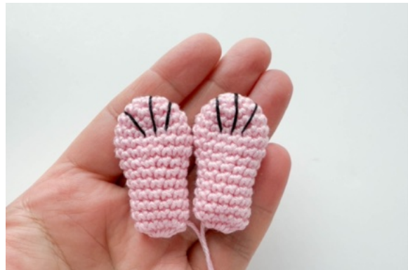
10. Ben, sy 3 svarta linjer