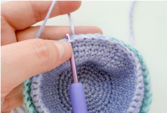
31. Virka en lös smygmaska