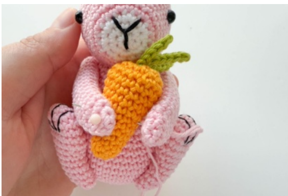
23. Sy fast moroten på armarna