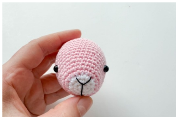
12. Brodera nosen i en "Y-form"