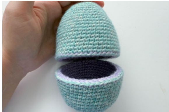
34. Äggets två delar