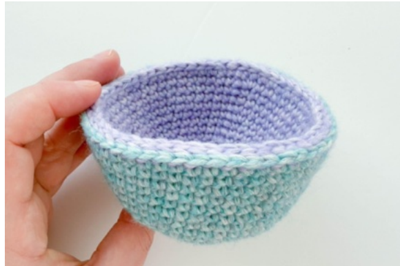
32. Äggets nedre del