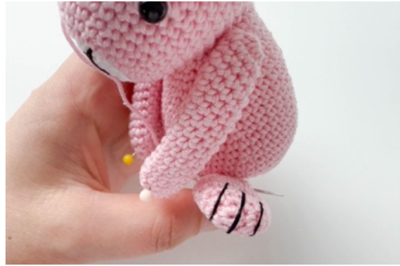
20. Fäst även mitten av benen på kroppen