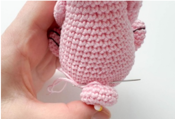
21. Sy fast svansen på kroppens baksida