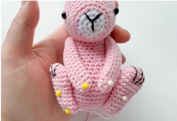
19. Placera benen diagonalt