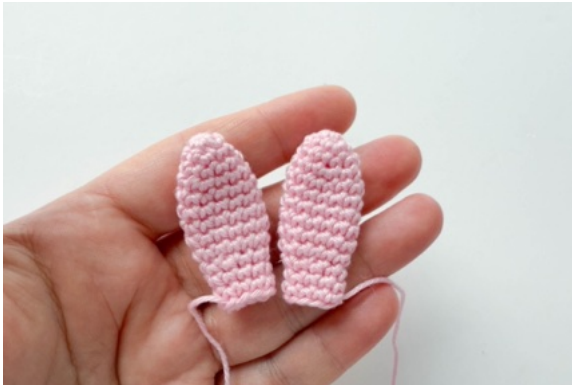
7. Öron, lämna en garnände till montering