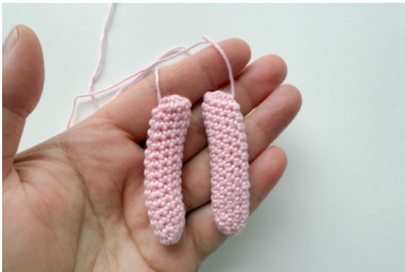
9. Armar, lämna en garnände till att sy med