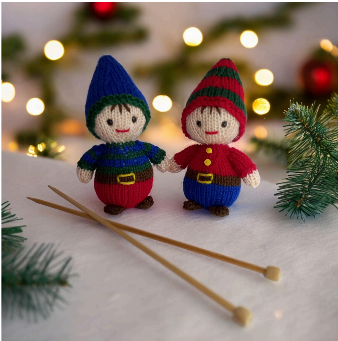
Mycket nöje! Claire Fairall Designs