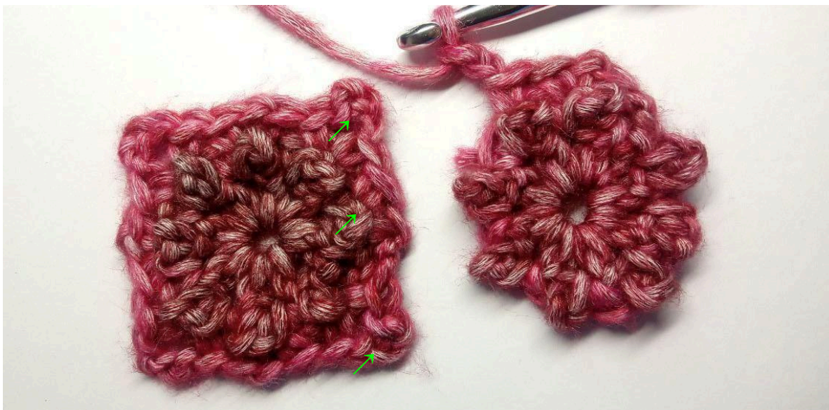
Ruta A (till vänster) Ruta B (till höger)

Samla ihop efter hand 2 (3) rutor på rad. För att göra detta, upprepa varv 1-2 för varje kommande ruta, och fortsätt med varv 3 så här: 1 lm (räknas inte som en maska), (1 fm, 1 lm, 1 fm) i nästa 1lm-mell, (1 fm, 2 lm) i nästa 1lm-mell, fm i 3lm-mell i hörnet på ruta A (håll rutorna med avigsidan ihop, sätt i virknålen bakifrån och fram när du virkar i ruta A), tillbaka till ruta B och virka 1 fm i samma mellanrum som föregående fm, fm i nästa 1lm-mell, fm i motsatta 1lm-mell på ruta A, tillbaka till ruta B och virka 1 fm i samma 1lm-mell som föregående fm, fm i nästa 1lm-mell, fm i 3lm-mell i motsatta hörnet på ruta A, 2 lm, tillbaka till ruta B och virka 1 fm i samma 1lm-mell som föregående fm, *(1 fm, 1 lm, 1 fm) i nästa 1lm-mell (1 fm, 3 lm, 1 fm) i nästa 1lm-mell* 2 gånger, samla ihop med en sm i 1.a fm. Klipp garnet och fäst garnändarna