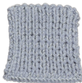
Cosy: Sky blue SBF: Light Grey