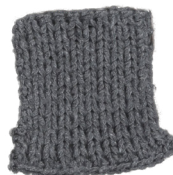
Cosy: Grey SBF: Grey