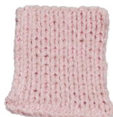
Cosy: Pastel Rose SBF: Light Pink