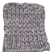
Cosy: Grey SBF: Light Pink