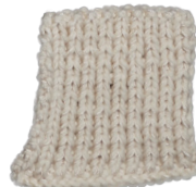
Cosy: Off White SBF: Off White