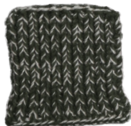
Cosy: Hunting Green SBF: Off White