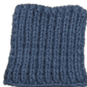
Cosy: Jeans Blue SBF: Jeans Blue