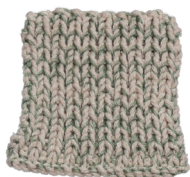
Cosy: Pastel Brown SBF: Soft Green