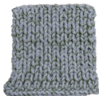
Cosy: Sky Blue SBF: Soft Green