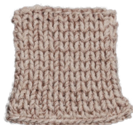
Cosy: Pastel Brown SBF: Nude Beige