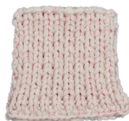
Cosy: Off White SBF: Light Pink