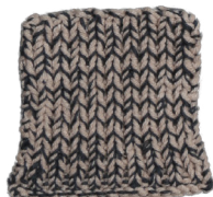
Cosy: Pastel Brown SBF: Dark Grey