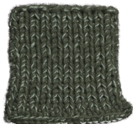
Cosy: Hunting Green SBF: Soft Green