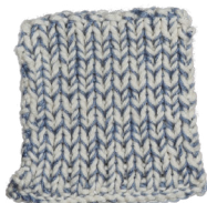
Cosy: Off White SBF: Jeans Blue