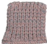
Cosy: Pastel Rose SBF: Light Grey