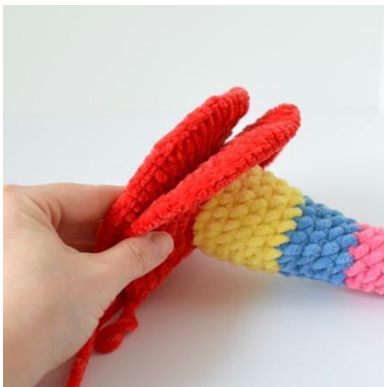
19. Placera basen ovanpå stängens botten