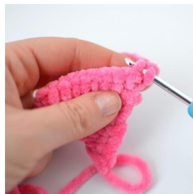
10. Virka i den bakre maskbågen