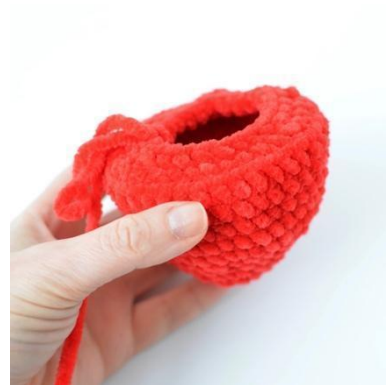
6. Virka i den bmb för att få en flat botten