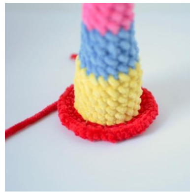
18. Virka i den främre maskbågen