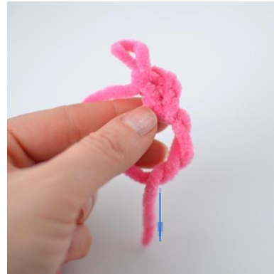
8. Börja vingen med en magisk ring