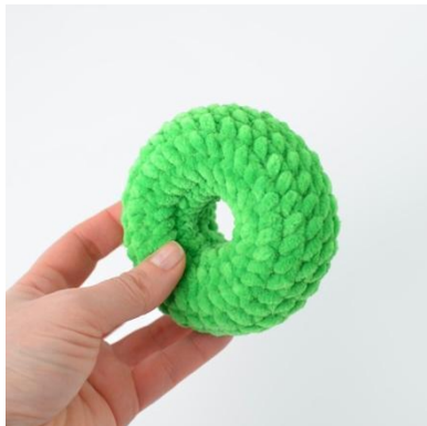
5. Färdig ring