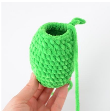
3. Alla varv är färdiga