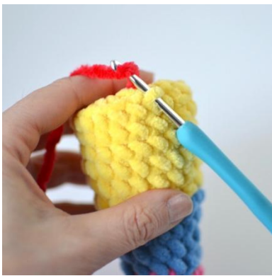
17. Virka i den främre maskbågen