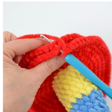
20. Sammanfoga delarna med sm