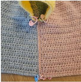
Sista varvet på kroppen

Nu ska du samla ihop sidorna med Färg A på båda sidor. Färdigställ dem med samma metod som du använde på oket. Börja i ärmhålan med 1m. Se 'Steg 2' på sidan 7. Du ska samla ihop 26(31, 34) (40, 46, 52, 56) sm. Avsluta.