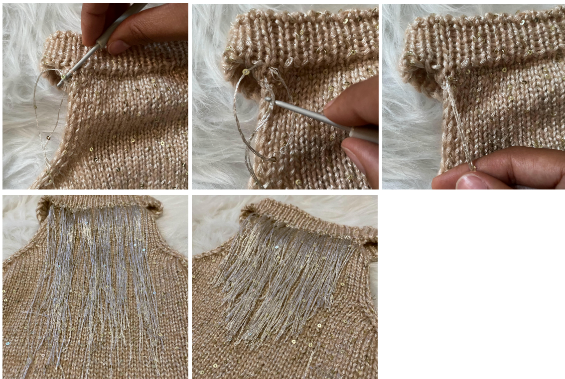
Mycket nöje! Aurélie from Mil y un hilo