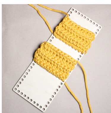
11) Virka andra skiljerummet likadant