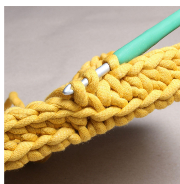
18) Fortsätt runt med hst.