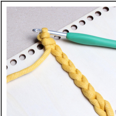
7) Virka 1 fastmaska.