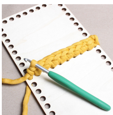
8) Virka fm i varje maska.