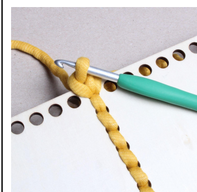
13) Virka 1 fm.