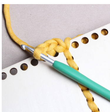
14) Virka fm i varje hål.