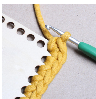
15) Virka 2 fm i varje hörn.