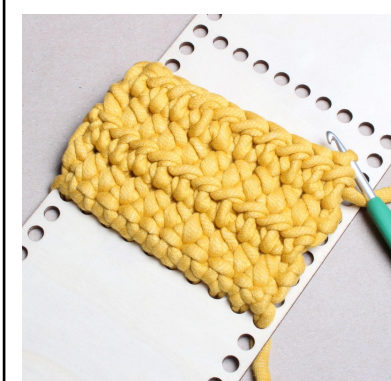
10) Fortsätt virka till önskad höjd