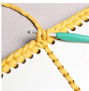
17) Virka 1 hst i första m.