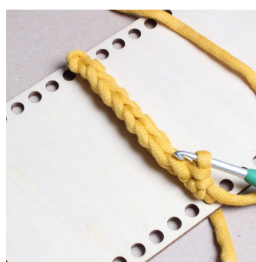
9) Vänd med 1 lm.