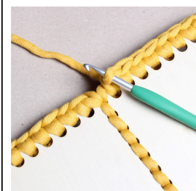
16) Virka färdigt varvet