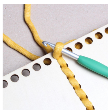
12) vänd träbotten och virka längs med sidan.