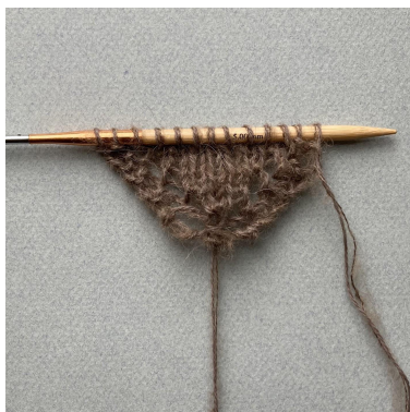
Påbörjan av bandana