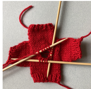
Upplockning till krage