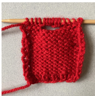
Upplägning till hals på bakstycket