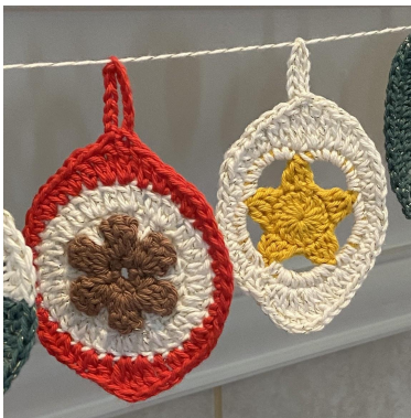
Popcorn och Stjärn dekoration

Varv 4: 3 lm, 2 st, [2 dst], [2 dst], 3 st, [2 hst], hst, 6 fm, 3 hst, [2 hst], 3 st, [2 dst], [dst, 10 lm, sm i dst, dst], 3 st, [2 hst], 3 hst, 6 fm, hst, [2 hst], Sm i toppen på de 3 lm, avsluta (48 m + 10 lm mellanrum).