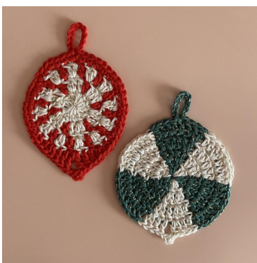
Pepparmint och Grön Virvel dekorationer

Varv 4: [2 lm (räknas som första hst), 1 hst]. 2 st, [1 dst, 3 lm, fm i första lm, 1 dst]. 2 st, [2 hst], 2 hst, {[2 fm], 2 fm}, upprepa { } 3 gånger till, [1 fm, 10 lm, fm i fm, 1 fm], 2 fm, upprepa { } 3 gånger till, [2 fm], 2 hst. Sm i toppen på 2.a lm, avsluta (48 m och 2 lm-mellanrum).