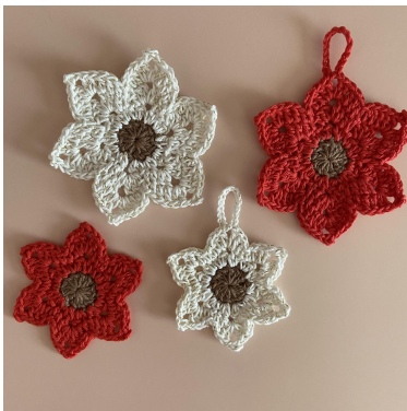
Den lilla och den stora Julstjärnan

Varv 3: 1 lm (räknas som första fm), 1 st. I 3 lm-mellanrummet [2 st, 15 lm, fm i första lm av de 15 lm, 2 st], 1 st, 1 fm. {1 fm, 1 st, i 3 lm-mellanrummet [2 st, 3 lm, 1 fm i första lm av de 3 lm, 2 st], 1 st, 1 fm}. Upprepa { } 4 gånger till. Sm i första lm, och avsluta. (48 m + 6 lm-mellanrum).