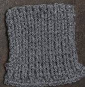
Cosy: Grey SBF: Grey