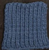
Cosy: Jeans Blue SBF: Jeans Blue