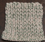
Cosy: Pastel Brown SBF: Soft Green