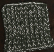
Cosy: Hunting Green SBF: Off White