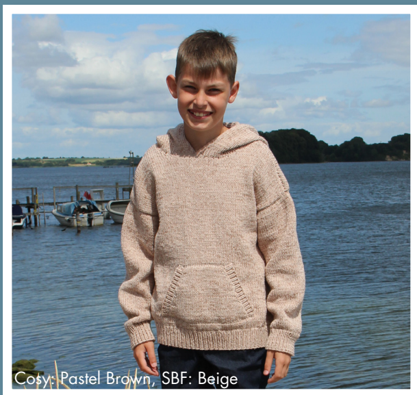
Cosy: Pastel Brown, SBF: Beige

Nyckeln till att sticka en specifik storlek är mer beroende på vilken stickstil/hur man håller stickorna/kunskap du har än att ha en viss storlek på stickan. Därför rekommenderar vi ett spann.