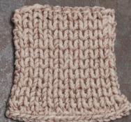
Cosy: Pastel Brown SBF: Nude Beige