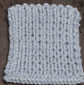
Cosy: Sky blue SBF: Light Grey