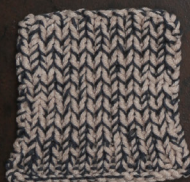
Cosy: Pastel Brown SBF: Dark Grey