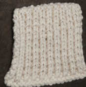
Cosy: Off White SBF: Off White