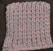
Cosy: Pastel Rose SBF: Light Grey