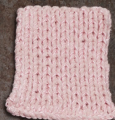
Cosy: Pastel Rose SBF: Light Pink