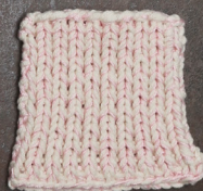
Cosy: Off White SBF: Light Pink