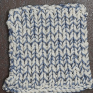
Cosy: Off White SBF: Jeans Blue