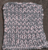
Cosy: Grey SBF: Light Pink