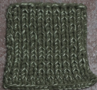
Cosy: Hunting Green SBF: Soft Green