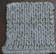
Cosy: Sky Blue SBF: Soft Green