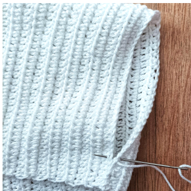
Sy ihop mössan från insidan