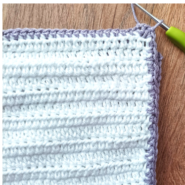
Sm i första m