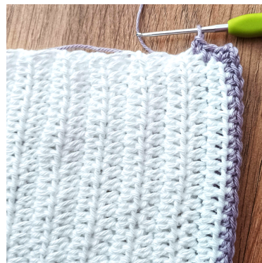
Fm längs baksidan av mössan