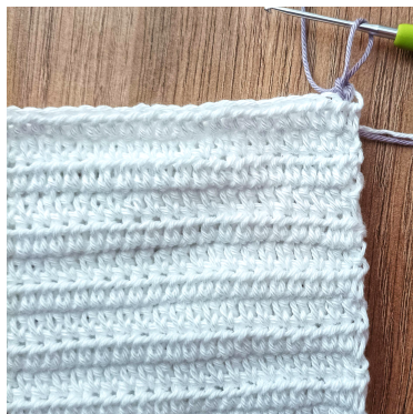
1 lm, [fm, 2 lm, fm] i samma m