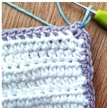
Sätt till en ny färg i 2lm-mellanrummet