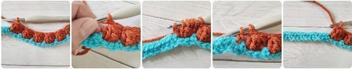
Bilden visar första raden med bubblor

(Titta på bilderna, från höger till vänster)