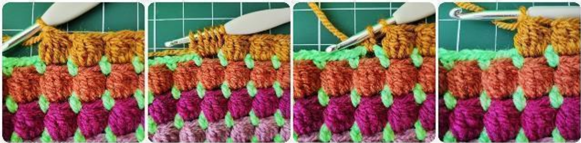
Bilden visar följande varv med bubblor