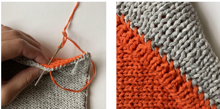
Bilder: Botten sys ihop, Färdig söm från rätsidan

Därefter vänds arbetet och botten sys ihop på avigsidan.