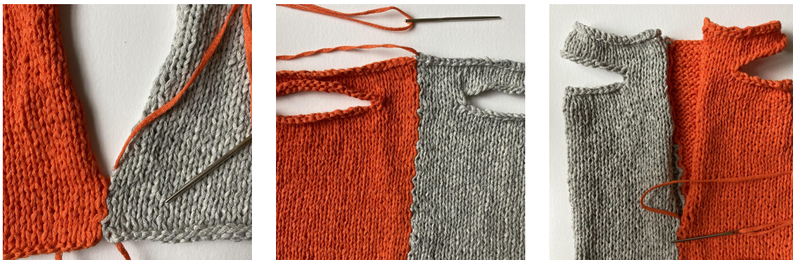
Bilder: Montering av sidor

Först sys sidsömmarna ihop med madrasstygn (arbetet sys ihop från rätsidan med delarna liggandes bredvid varandra).