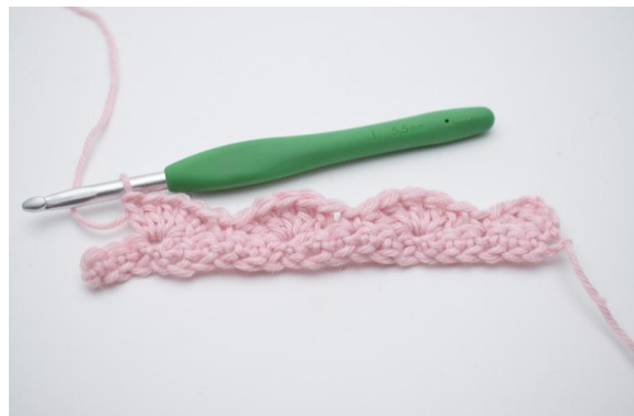
12. Upprepa detta varv tills det är 3 m kvar.