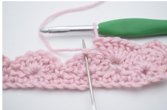
8. Hoppa över 2 m,