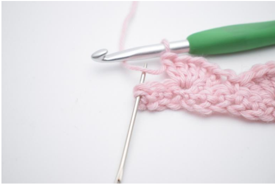
13. I sista m (den som nålen på bilden markerar),