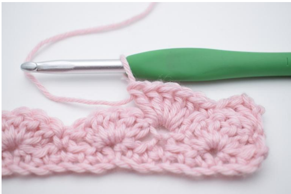
7. virka 5 st i nästa m.