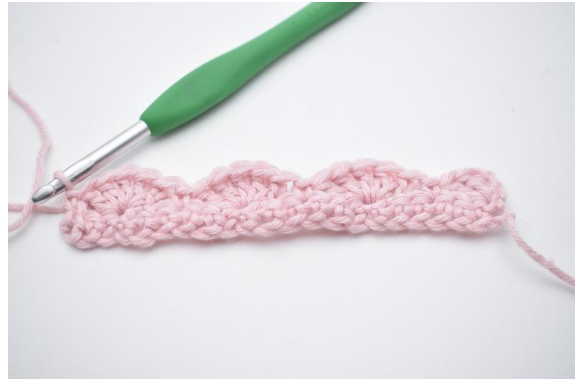
14. virkas 1 fm.