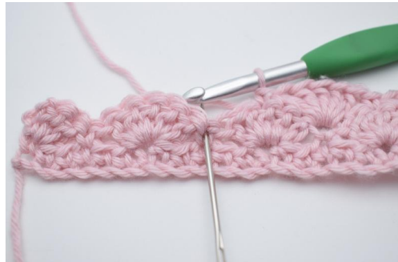
10. Hoppa över 2 m,