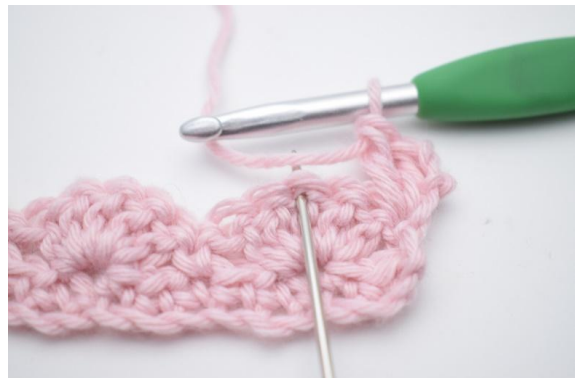
4. Hoppa över 2 m,