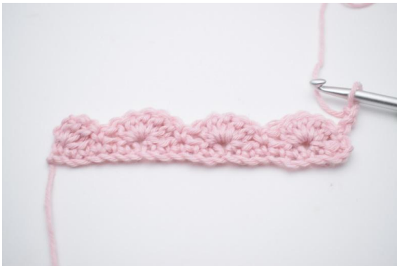
1. Vänd med 3 lm.