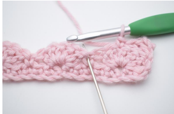
6. Hoppa över 2 m,