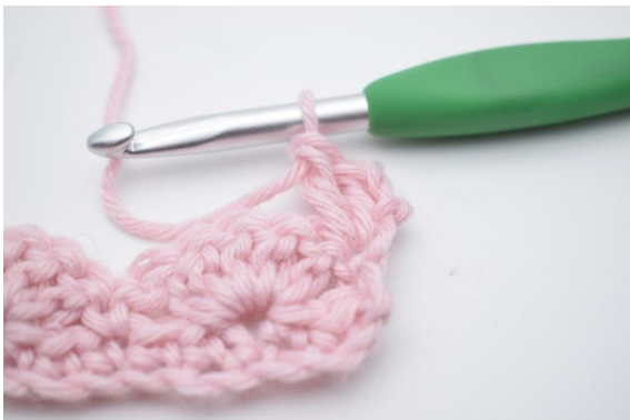
3. virkas 2 st.