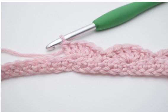
11. virka 5 st i nästa m.