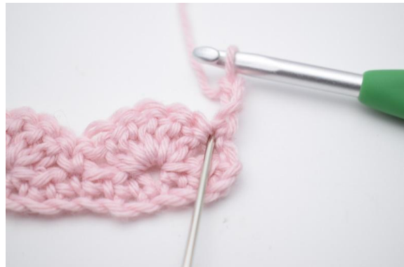
2. I första maskan (den som nålen på bilden markerar),