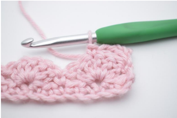
5. virka 1 fm i nästa m.