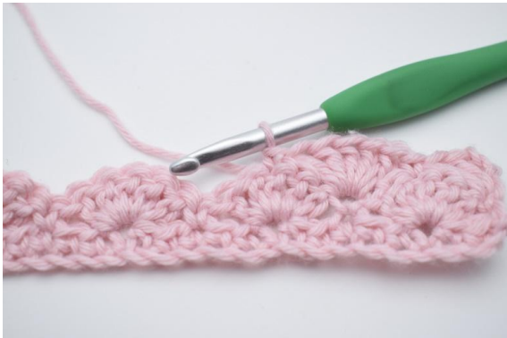
9. virka 1 fm i nästa m.