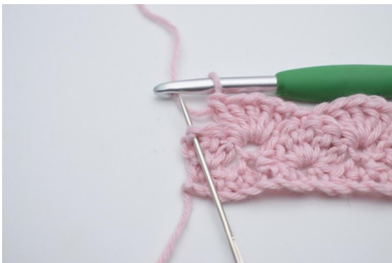
13. I sista m (den som nålen på bilden markerar),