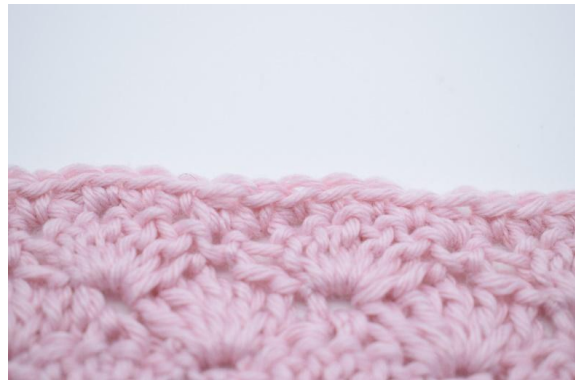
8. Upprepa varvet ut. Klipp av garnet och fäst trådarna