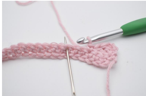
6. Hoppa över 2 m,