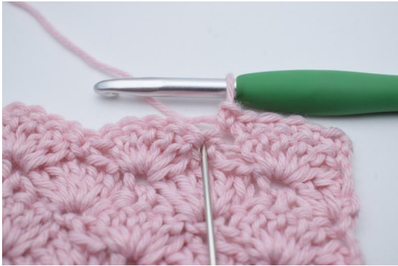
3. I nästa m (den som nålen på bilden markerar),