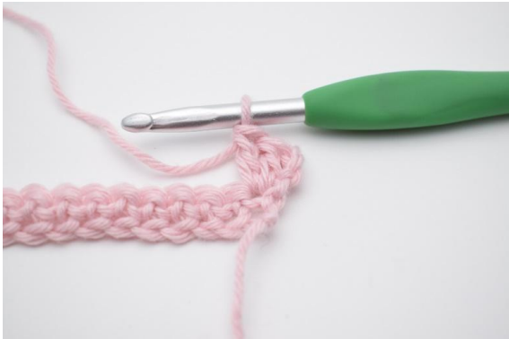
3. virkas 2 st.