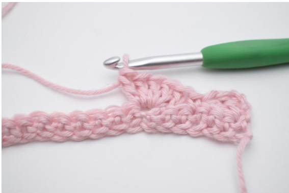
7. virka 5 st i nästa m.