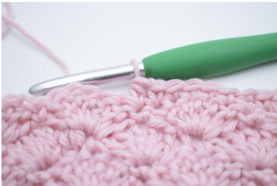
7. virkas 1 hst.