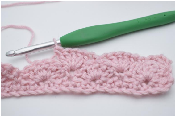
11. virka 5 st i nästa m.