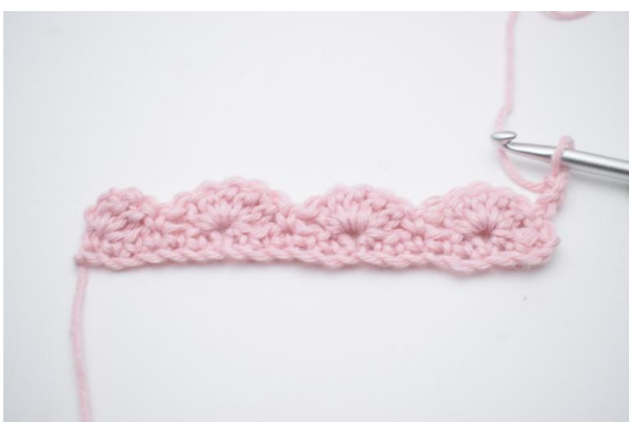
1. Vänd med 3 lm.