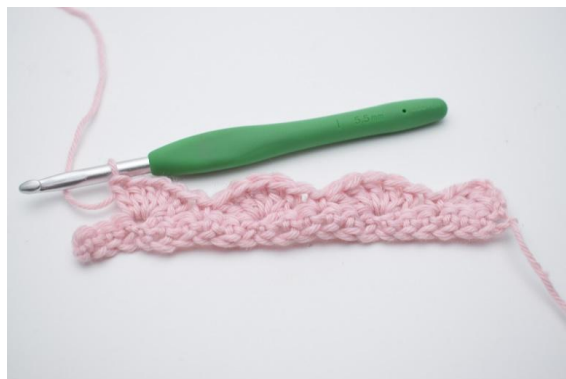
12. Upprepa detta varv tills det är 3 m kvar.