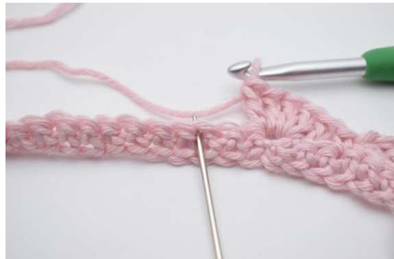
8. Hoppa över 2 m,