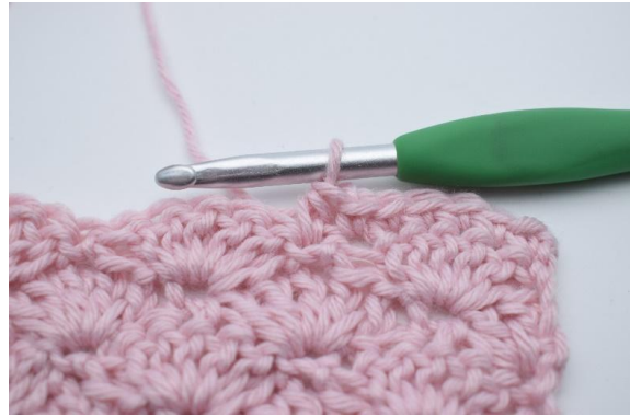
4. virkas 1 hst.