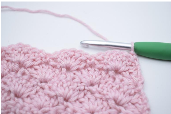
1. Vänd med 1 lm.