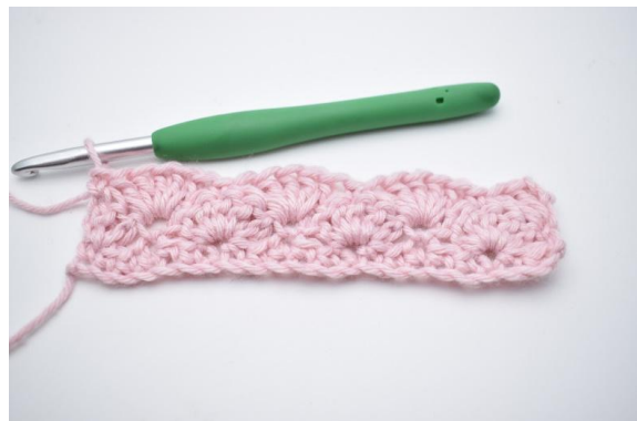
14. virkas 1 fm. Upprepa varv 3 som beskrivits i mönstret.