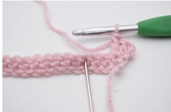
4. Hoppa över 2 m,