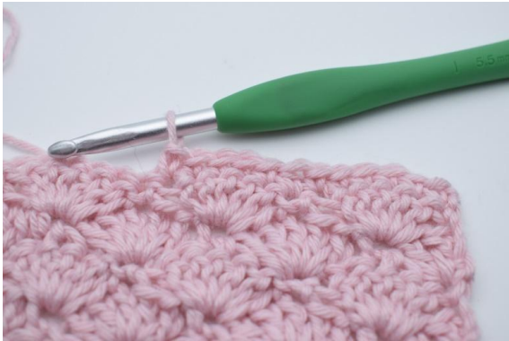
5. Virka 1 fm i de nästa 5 m.