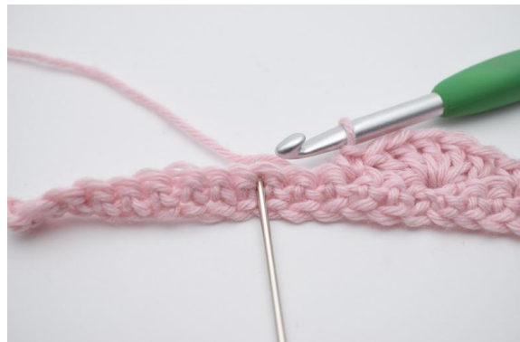
10. Hoppa över 2 m,