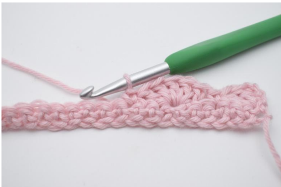
9. virka 1 fm i nästa m.