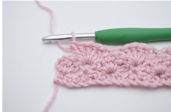
12. Upprepa detta varv tills du har 3 m kvar,