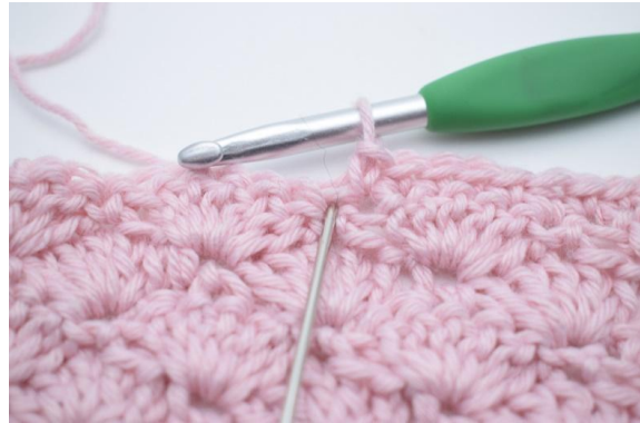
6. I nästa m (den som nålen på bilden markerar),