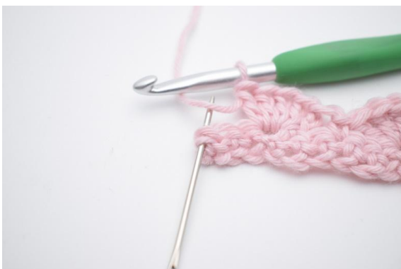
13. I sista m (den som nålen på bilden markerar),