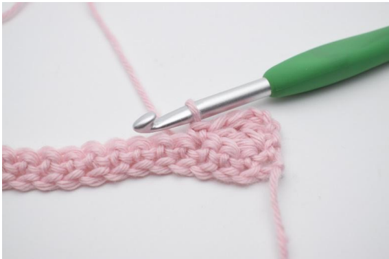
5. virka 1 fm i nästa m.