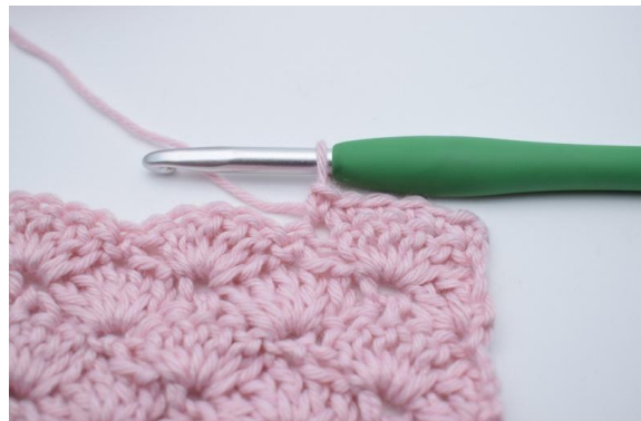
2. Virka 1 fm i de nästa 5 m.