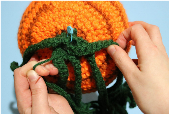
3. Så här ska det se ut när du drar i garnändan.