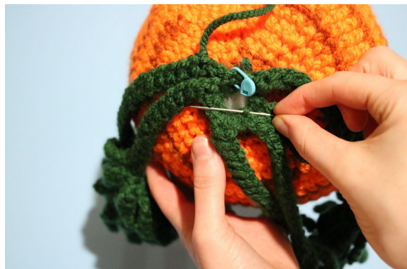
2. Lämna ung 40 cm tråd och trä den på en nål. För nålen genom bmb mitt emot maskmarkören, detta placerar sista bladet i mitten av bladgruppen.