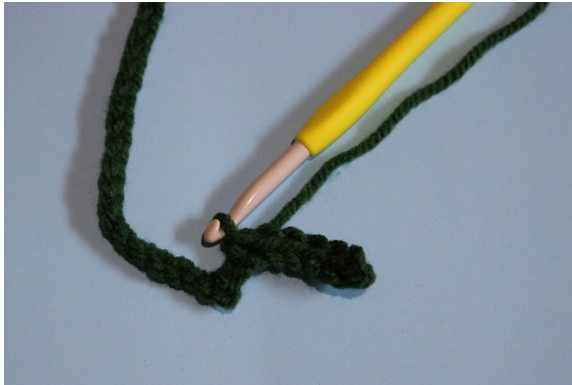
3. I 2: a lm från nålen virka 6 sm