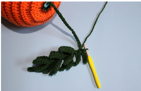
5. Upprepa steg #8 18 gånger (19 små blad totalt) och virka sm i återstående 20 lm