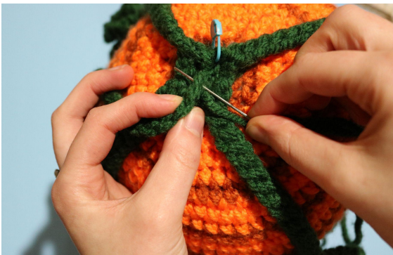
5. För nålen genom botten av sista bladet och in genom maskan precis bakom det, detta kommer hålla bladet på plats i mitten.