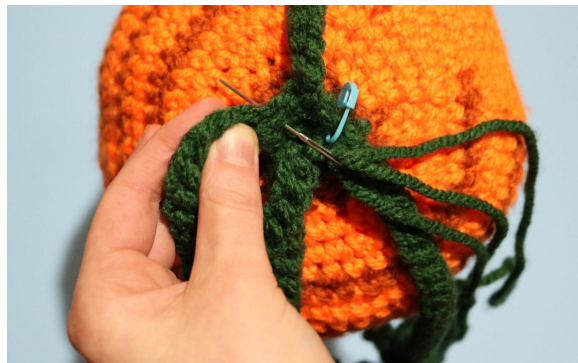
6. Fortsätt sy runt i bmb för att stänga igen alla hål, stick ut nålen genom sidan och fäst tråden. Voila!