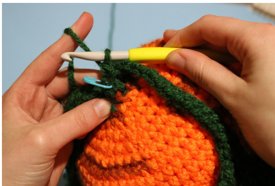
1. I första m; fm i fmb, gör 40 lm, i 2:a lm från nålen; *sm och 7 lm, i 2:a lm från nålen virka 6 sm*, Upprepa * - * 19 gånger, sm i återstående luftmaskor,