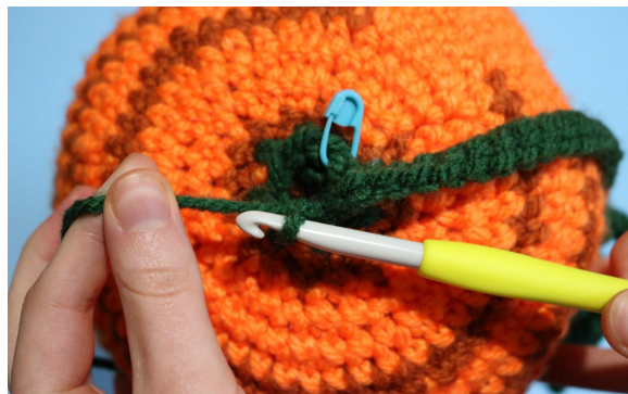
6. Sm i fmb i nästa m, (börja sedan på blad B)