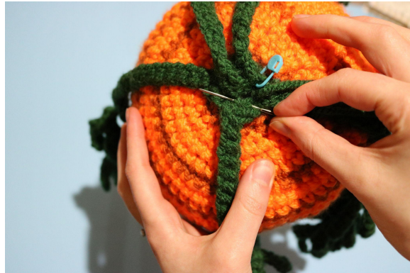
4. Stick ner nålen 2 maskor ovanför