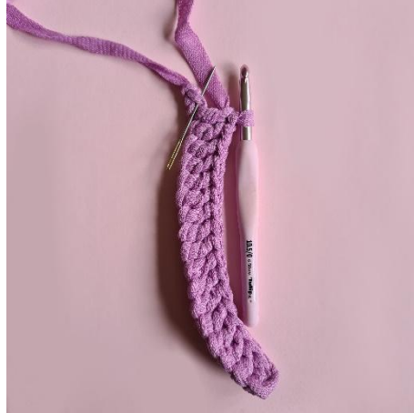
2. 16 st, 3 st i samma m