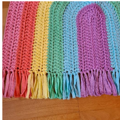
Njut! Super Cute Design / Jennifer Santos