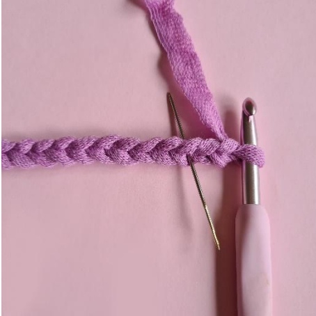
1. Gör 20 lm, börja i 3:e lm från nålen