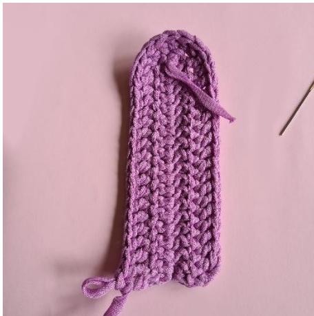
9. 16 st. 1 st i vlm. Vänd