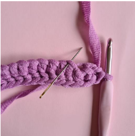
3. vänd utan att vända på arbetet. 16 st.