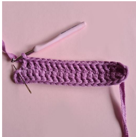
4. 2 st i sista m.