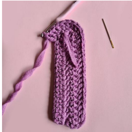
8. [öka 1 m] x5,