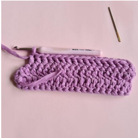
7. 16 st.