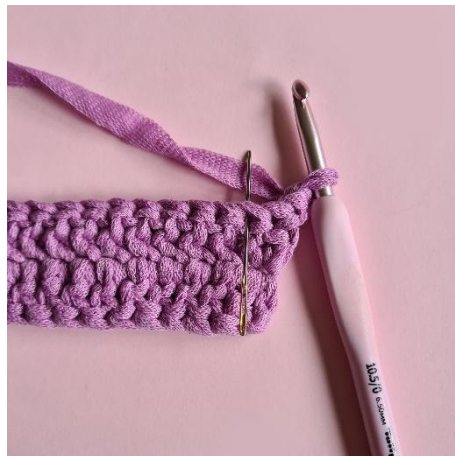
2 lm, hoppa över första m