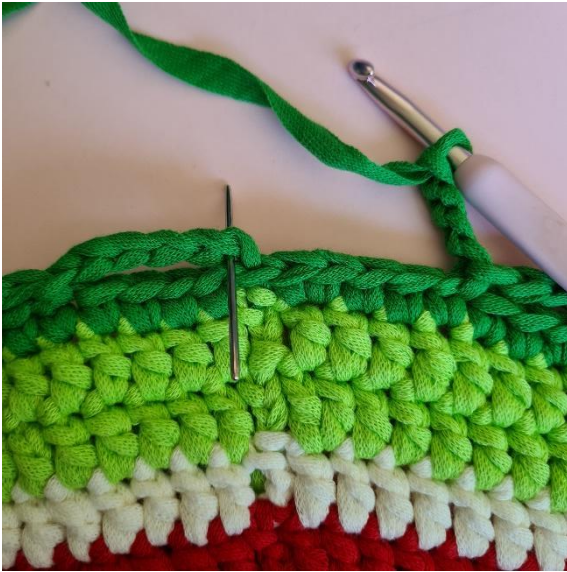
Avsluta med 1 sm i den första lm