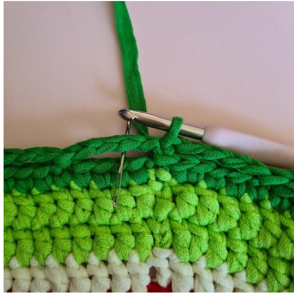
[3 fm, 1 lm, 3 fm]