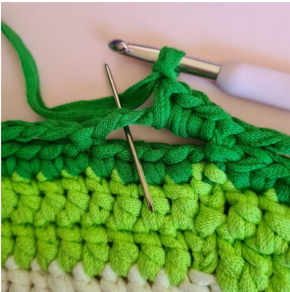
[3 fm, 1 lm, 3 fm] i varje luftmaskögla varvet ut.