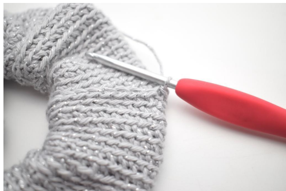
12. Sådär. Du har nu virket 1 sm.