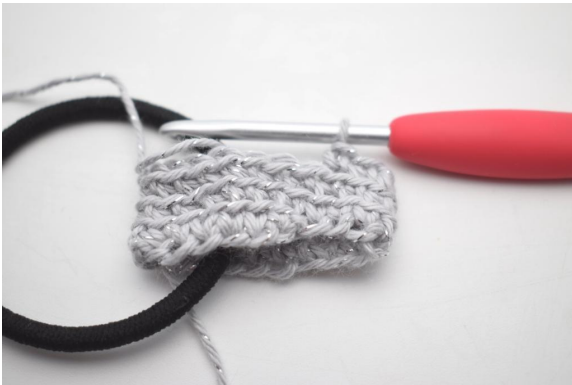
9. Upprepa varv 2.