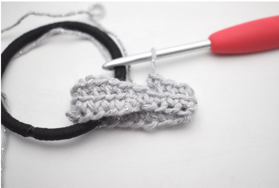
8. Virka fm i bmb varvet runt. (20).