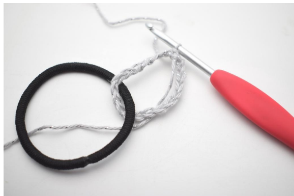
2. Samla lm till en ring med 1 sm runt din hårsnodd.