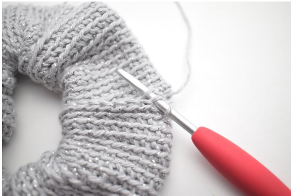
13. Virka 1 sm genom nästa bmb och uppläggningens kantens m.