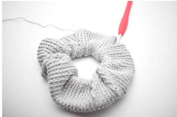
10. Upprepa tills du har ung. 95 varv.