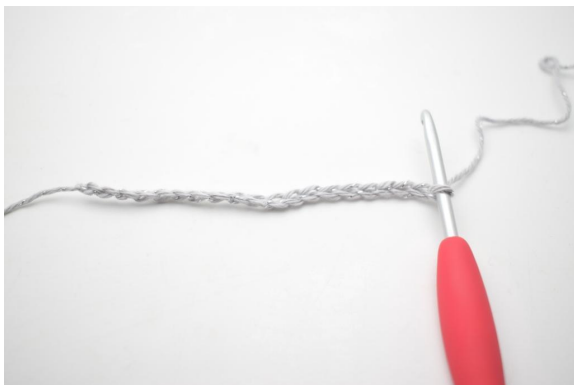
1. Lägg upp 20 lm.