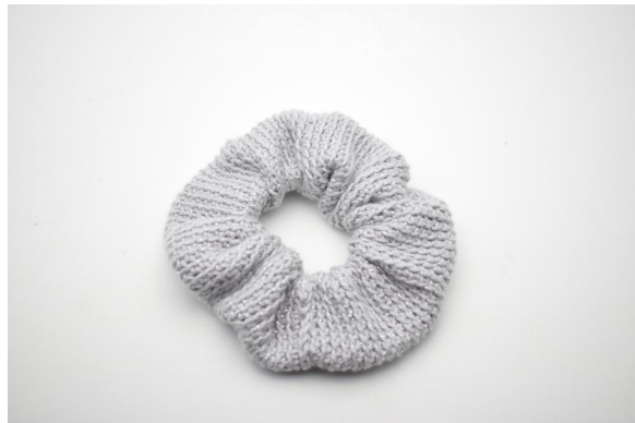
16. Klipp garnet och fäst trådarna.