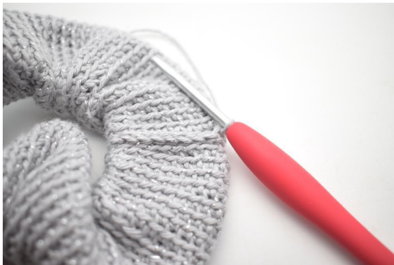
15. Upprepa varvet runt.