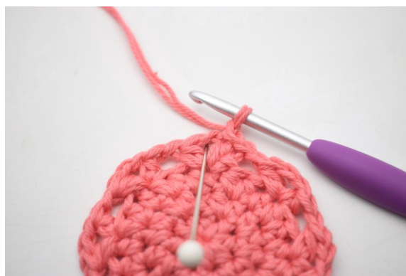
17. "Virka 4 hst, 1 lm och 4 hst i lm-bågen".