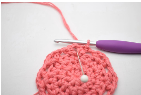
14. Gör sm fram till den första lm-bågen.