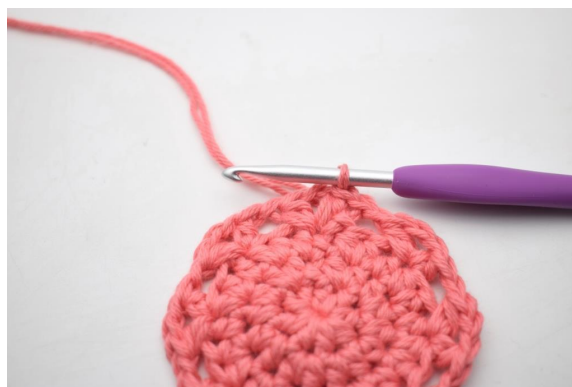
15. Så här.