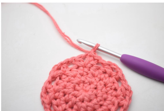
16. Gör 1 lm.