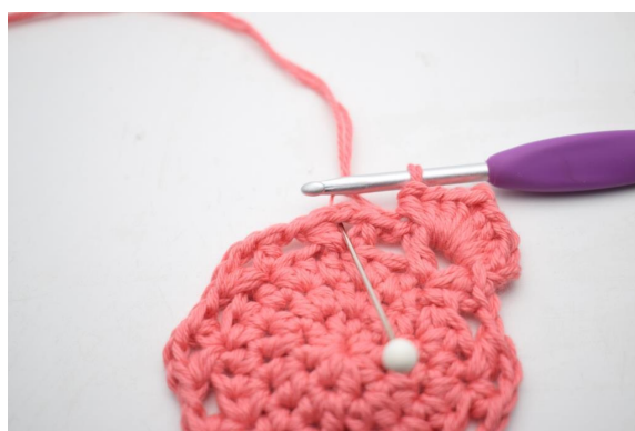
19. "Virka 4 hst, 1 lm och 4 hst i lm-bågen".