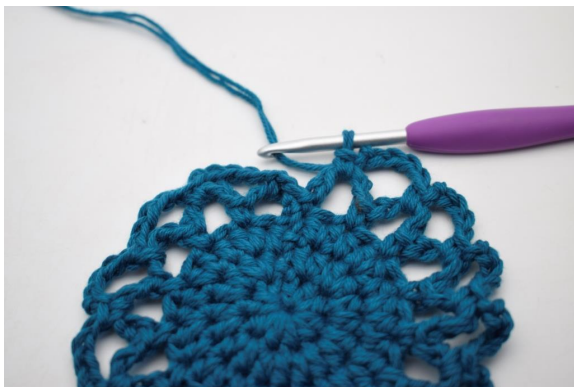
20. Upprepa "till" varvet runt.