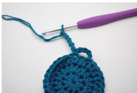
8. "Gör 5 lm.