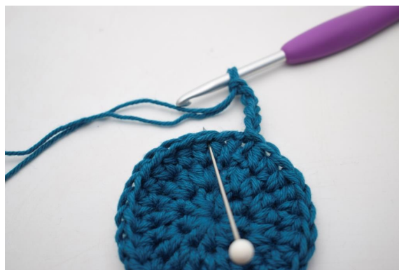
6. hoppa över 1 m och virka 1 fm i nästa m".