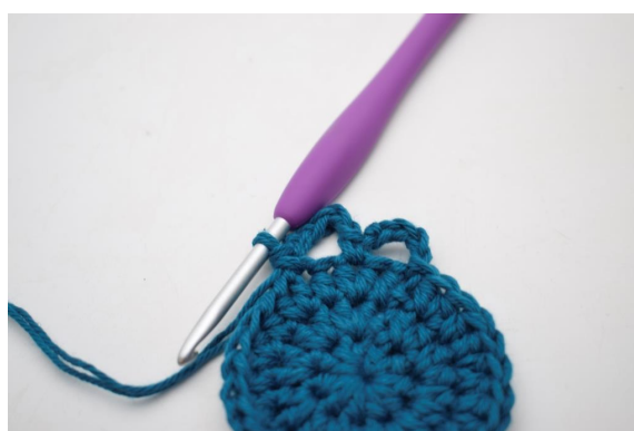
10. Så här.