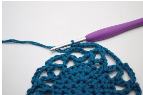
23. Så här.