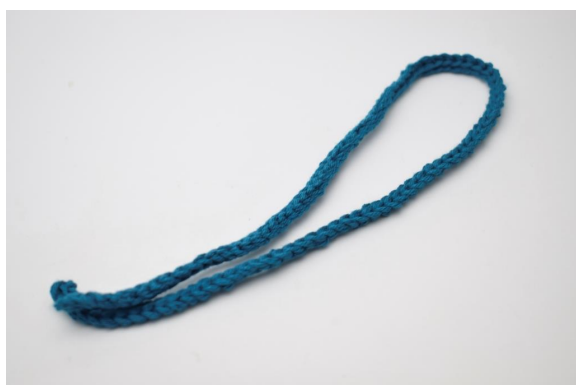
5. Klipp garnet och fäst trådarna.