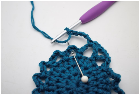
18. "Gör 5 lm, virka 1 fm i nästa lm-båge".