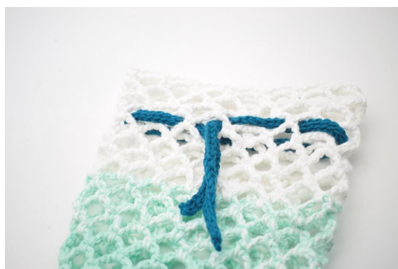
6. Trä knytbandet runt i hålen på varv 61-62..