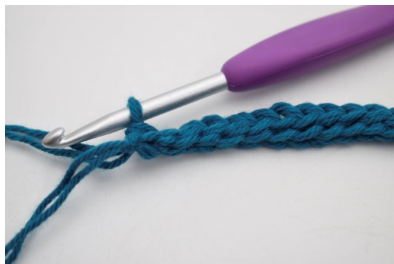
4. Virka sm i alla maskbågarna varvet ut.