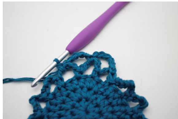
19. Så här.