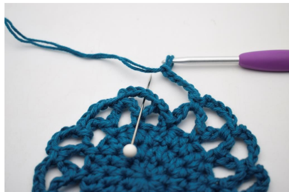
20. Varvet avslutas med 1 fm i den första av de lm-bågar som gjorts på detta varv.