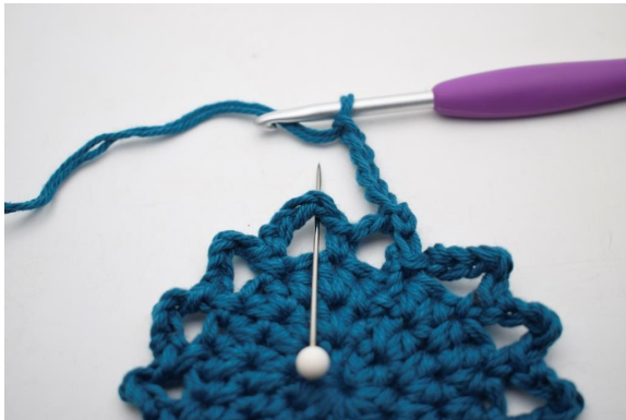
16. "Gör 5 lm, virka 1 fm i nästa lm-båge".