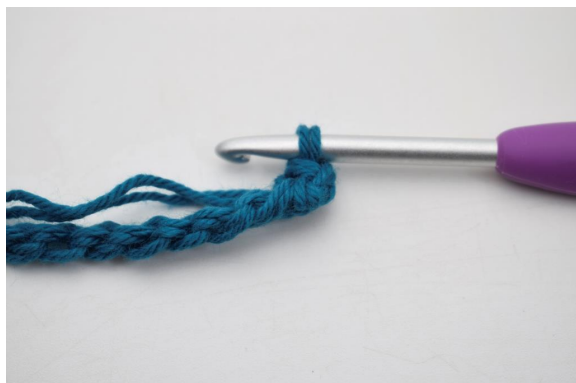
3. Så här.