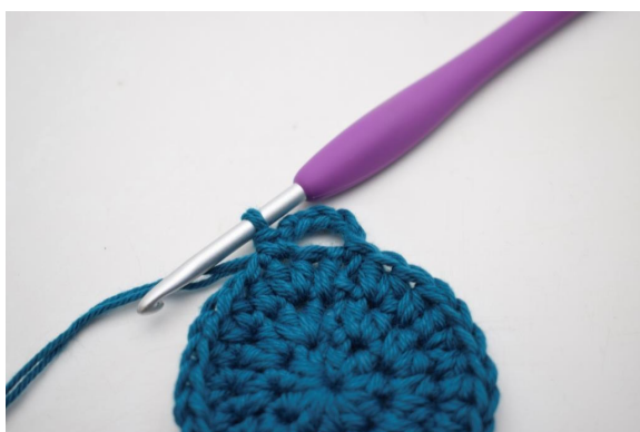
7. Så här.