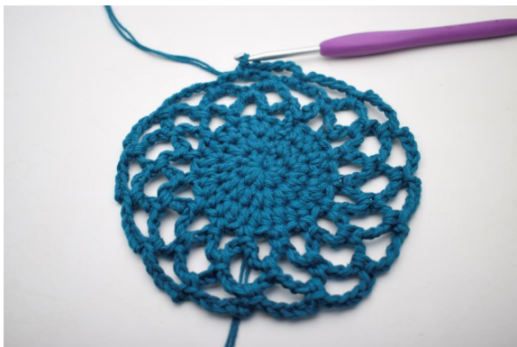
24. Upprepa "till" varvet runt. (15 lm-bågar)