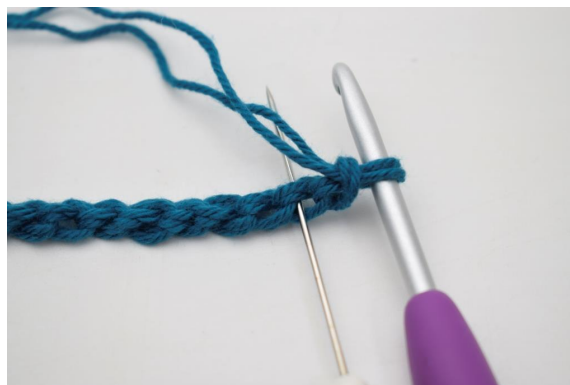
2. Vrid din lm-rad så att de bakre lodräta maskbågarna kommer fram. Virka 1 sm i 2.a maskbågen från virknålen.