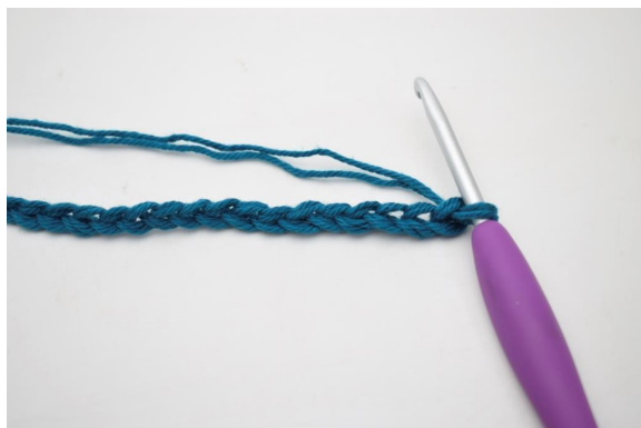
1. Lägg upp 100 lm.