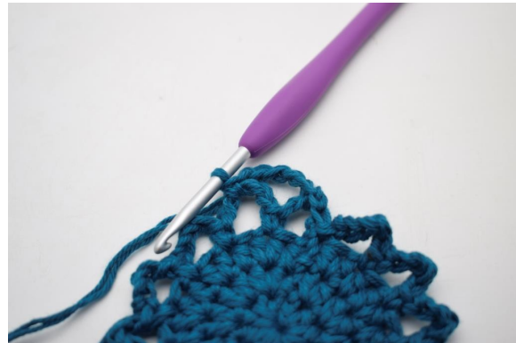
17. Så här.