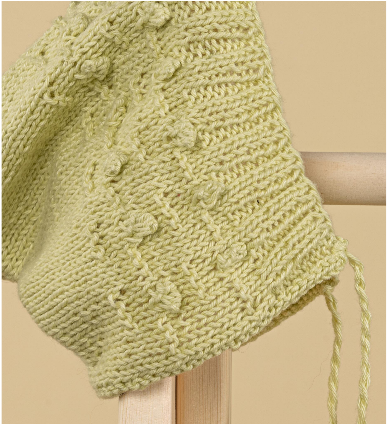
Mycket nöje! Sanna Mård Castman - Solorado