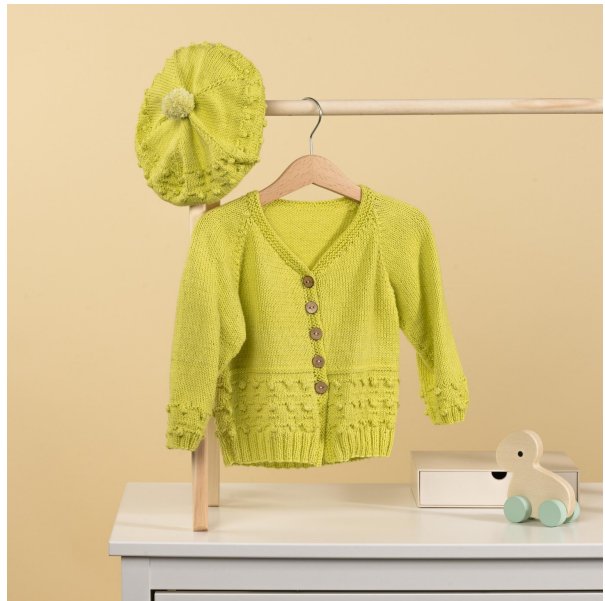
Mycket nöje! Sanna Mård Castman - Solorado