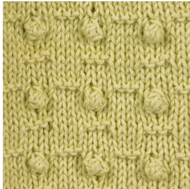
Mycket nöje! Sanna Mård Castman - Soolorado