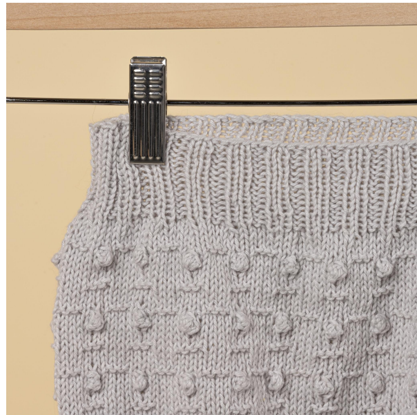
Mycket nöje! Sanna Mård Castman - Soolorado