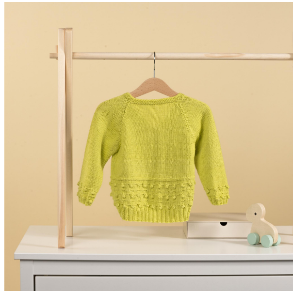
Mycket nöje! Sanna Mård Castman - Solorado