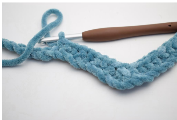
10. Virka 1 fm i de följande 8 lm.