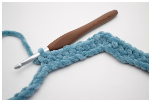
12. Virka 1 fm i de följande 8 lm.