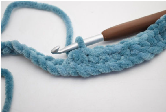
13. Virka 3 fm tills.