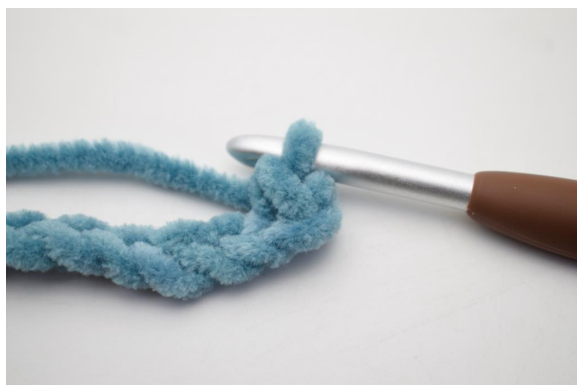
3. Så här.