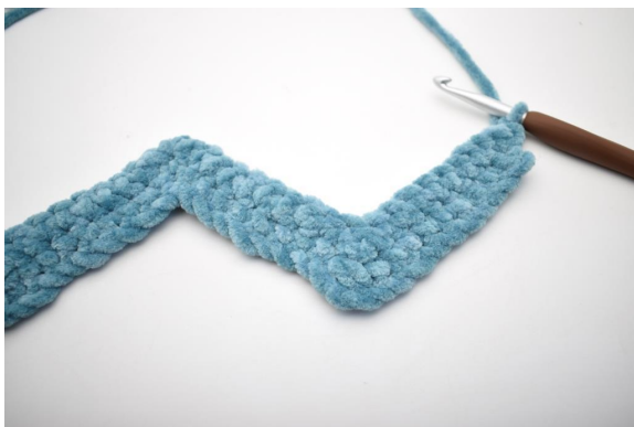
27. Detta varv virkas som varv 2. Vänd med 1 lm.