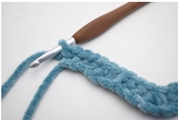
15. Virka 2 fm i sista lm.