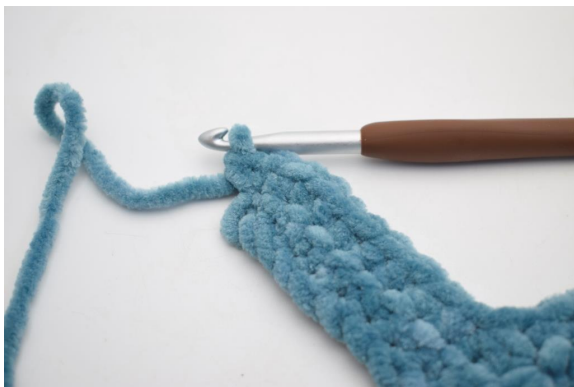
26. Virka 2 fm i sista m.