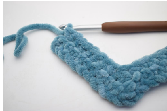
25. Virka 1 fm i de följande 8 m.