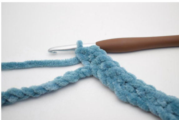
7. Virka 3 fm i nästa lm”.