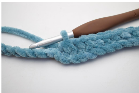
5. Virka 3 fm tills.