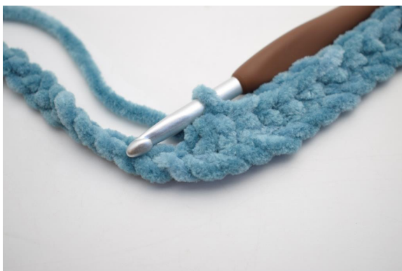
9. Virka 3 fm tills.