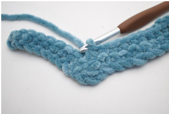
24. Virka 3 fm tills.