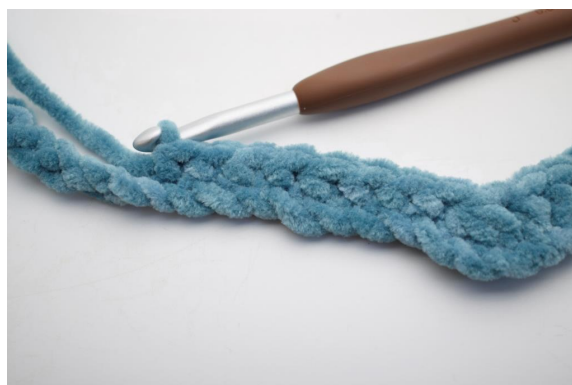
6. Virka 1 fm i de följande 8 lm.