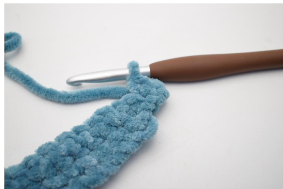
28. Virka 2 fm i första m.