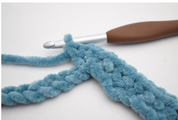
11. Virka 3 fm i nästa lm”.