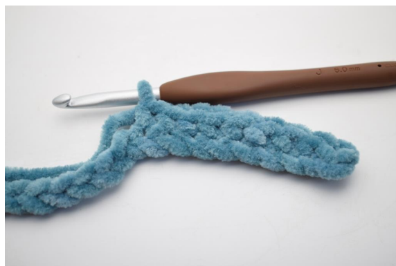
4. "Virka 1 fm i de följande 8 lm.