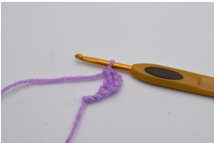
3. Så här.