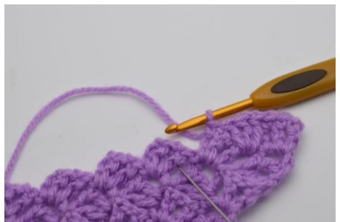
6. Såhär. Virka 3 st mellan "fyrfkanterna" på de 2 föregående varv. Nålen på bilden visar hur du ska virka.