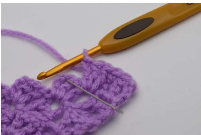
5. Hoppa 2 st och virka 1 fm i lm-bågen.