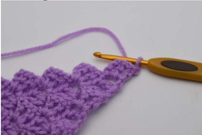
1. Vänd arbetet med 1 lm.