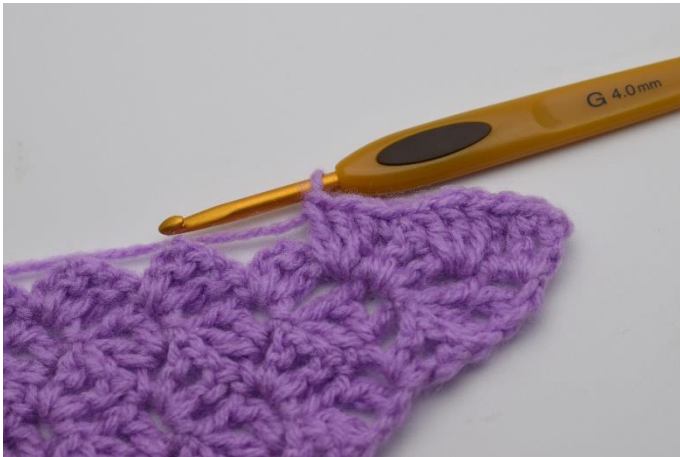
7. Så här.