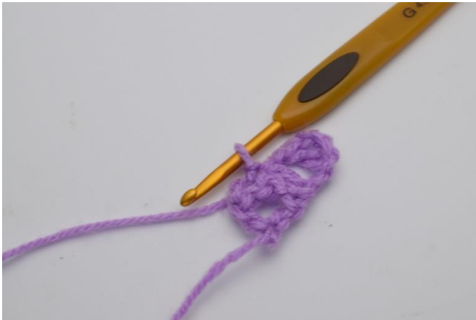
5. Så här.