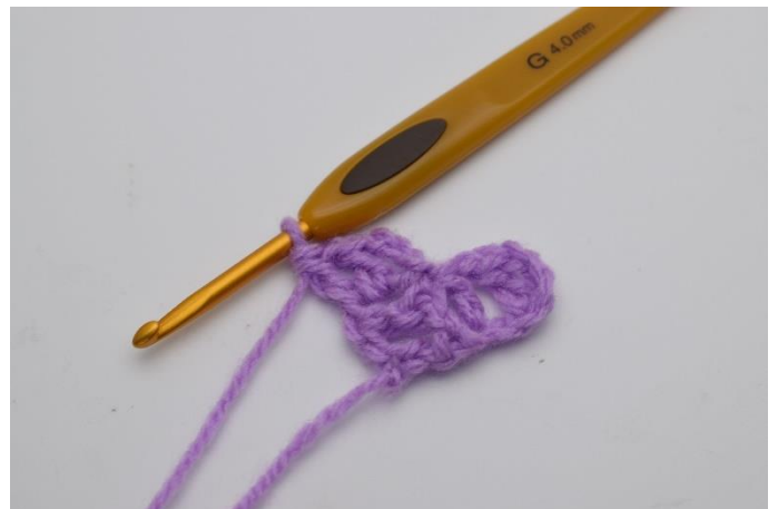
8. Du har nu gjort en "fyrkant" till. Varv 2 har nu 2 "fyrkanter".