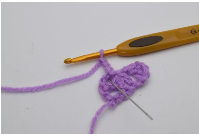
7. Virka "1 st, 1 lm och 1 st" ner i lm-bågen som du precis virkade 1 sm i.