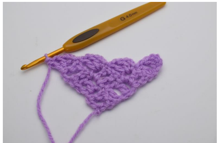
8. Virka 3 lm och virka "1 st, 1 lm och 1 st" ner i lm-bågen som du precis virkade 1 sm i