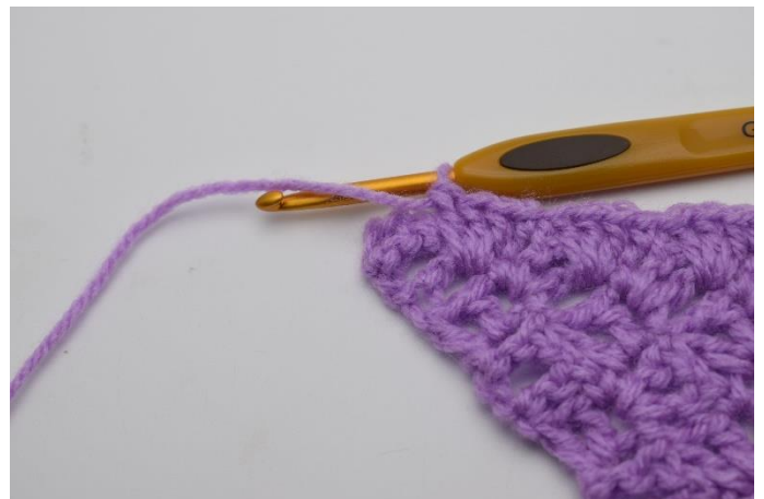
10. Upprepa varvet ut.