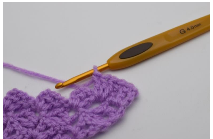
4. Virka 3 st.