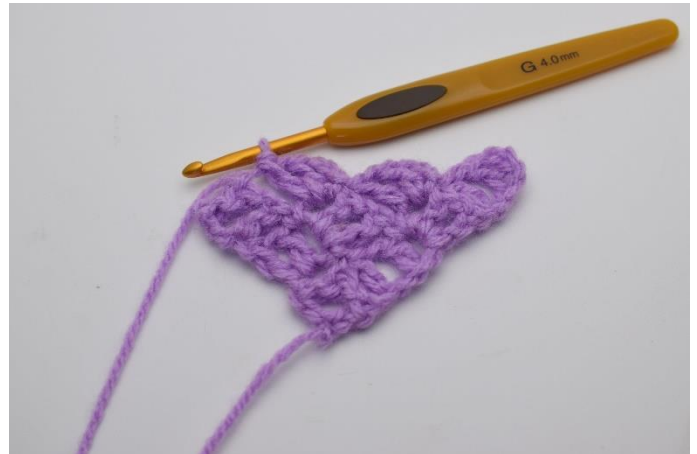
6. Virka 3 lm och virka "1 st, 1 lm och 1 st" ner i lm-bågen som du precis virkade 1 sm i.