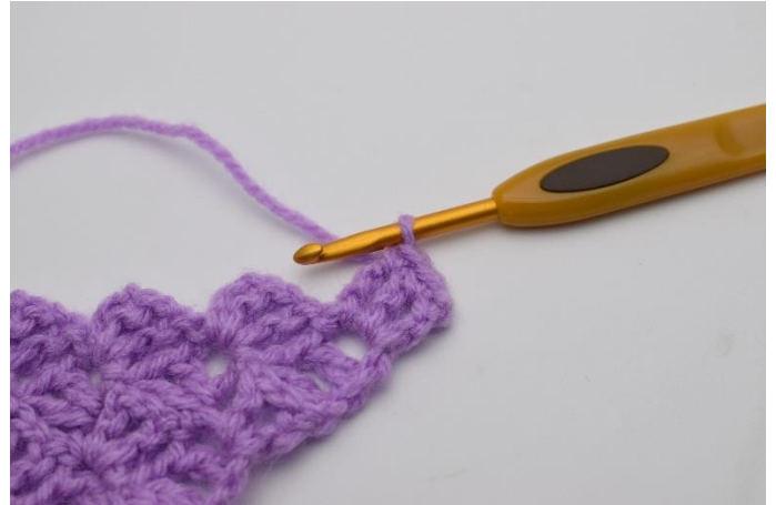
2. Virka 1 fm i de 2 st.