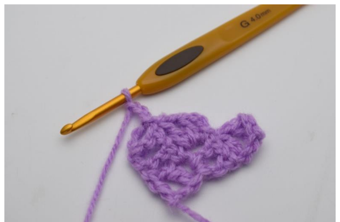
8. Virka 3 lm.