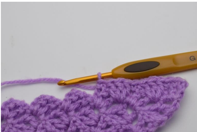
9. Så här.