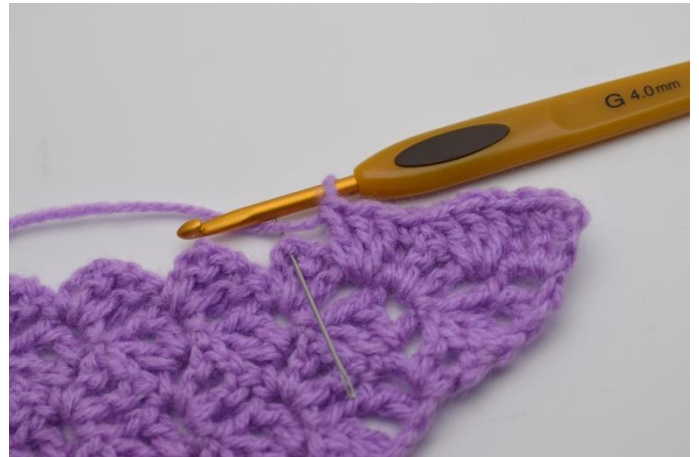
8. Hoppa 2 st och virka 1 fm i lm-bågen.