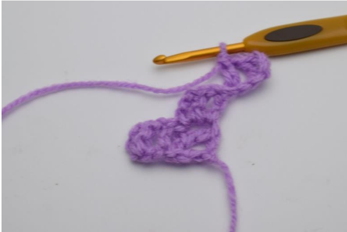
3. Virka 1 lm, och virka 1 st i sista lm.