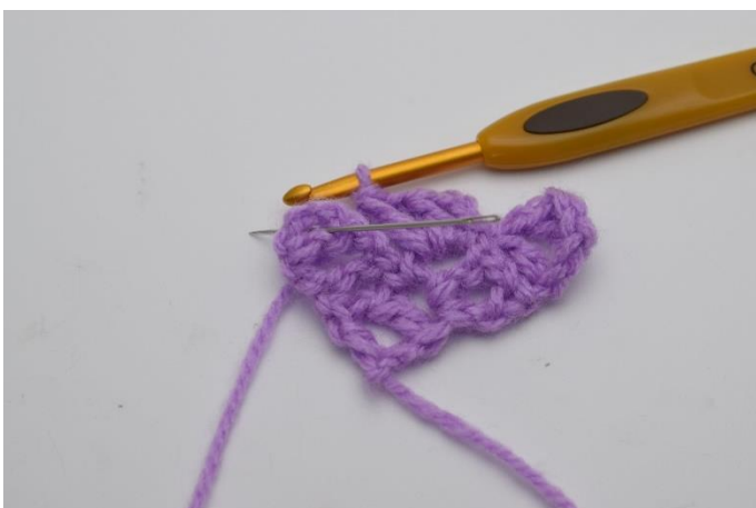
7. Virka nu 1 sm i fyrkanten nedanför. Nålen på bilden visar hur du ska virka din sm.