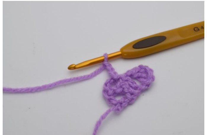
6. Virka 3 lm.