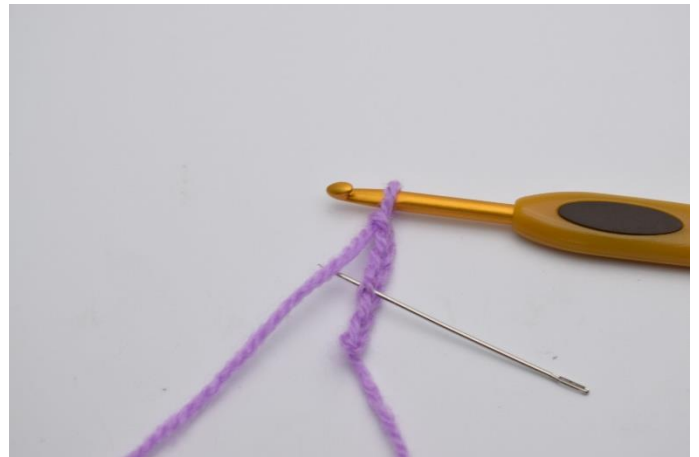
2. I 4:e lm från nålen, virka 1 st.