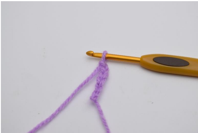
1. Börja med att lägga upp 6 lm.