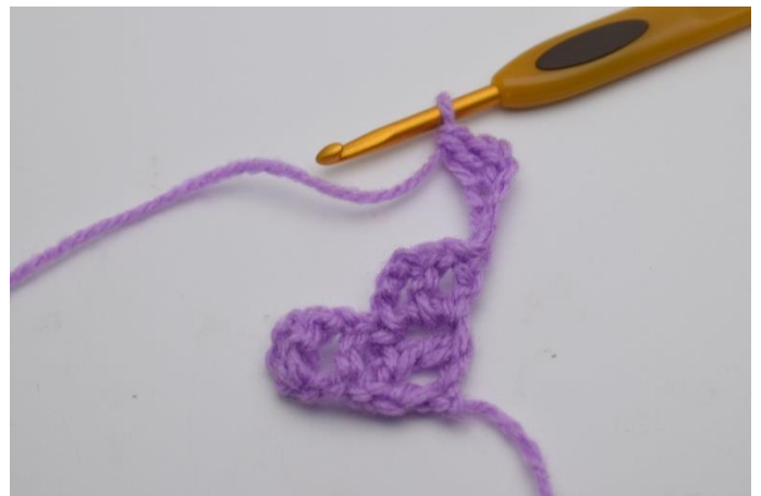
2. Virka 1 st i 4:e lm från nålen.