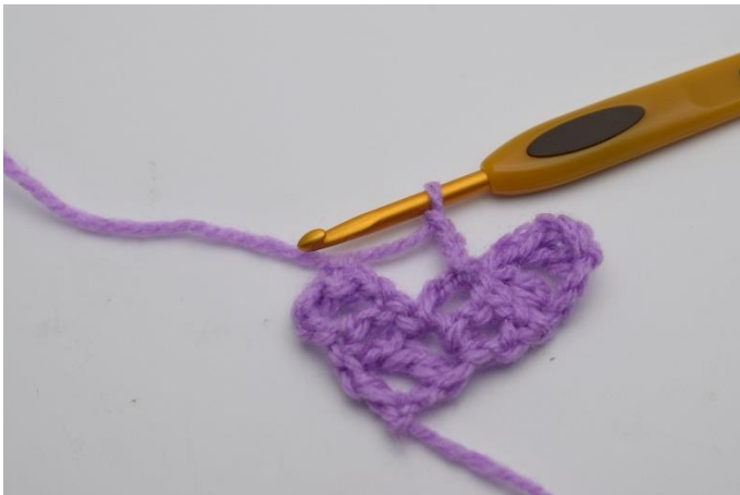
5. Virka 3 lm.