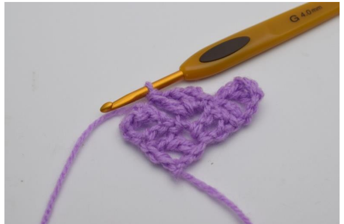
6. Virka "1 st, 1 lm och 1 st" ner i lm-bågen som du precis virkade 1 sm i.