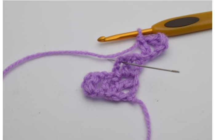
4. Virka nu 1 sm i fyrkanten nedanför. Nålen på bilden visar hur du ska virka din sm.