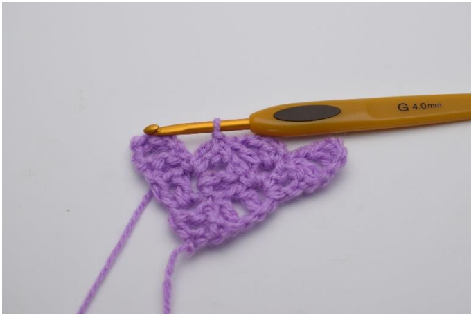
5. Virka 1 sm i fyrkanten nedanför.