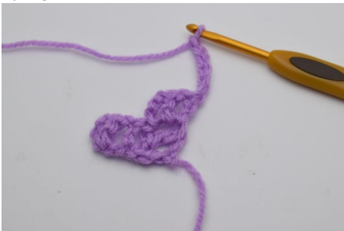
1. Vänd arbetet och virka 6 lm.