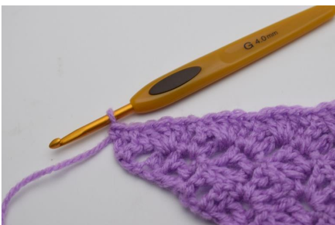
11. Avsluta med fm i de återstående st. Klipp garnet och fäst trådarna.