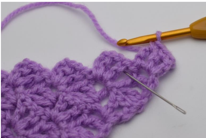
3. Nu ska du virka mellan "fyrfkanterna" på de 2 föregående varv. Nålen på bilden visar hur du ska virka.