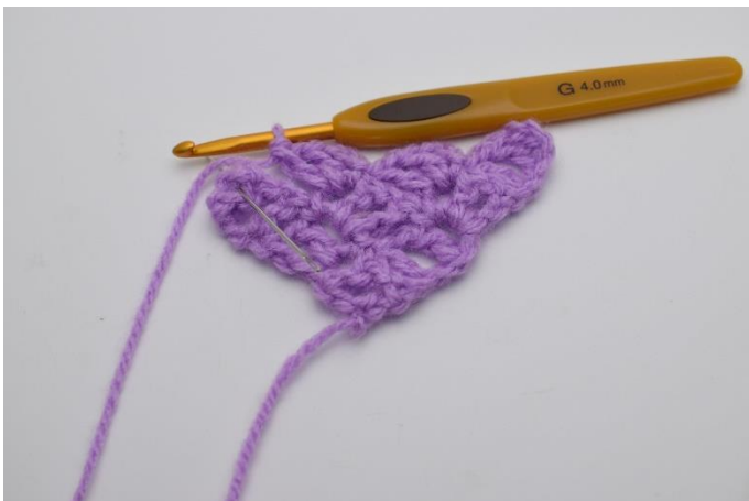
7. Virka 1 sm i fyrkanten nedanför.