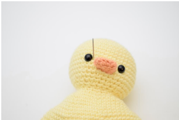
3. Stick ut nålen på höger sida om det andra ögat.