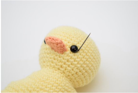
1. Sätt i garn och nål i den ena sidan av höger öga.