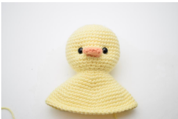
5. Strama tråden lätt, så att ögonen blir lite indragna. Fäst ändarna.