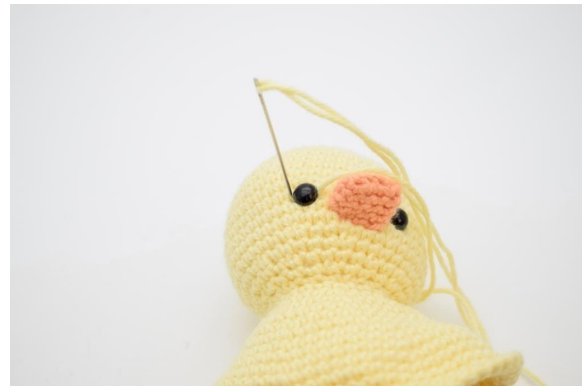
4. Stick ner nålen på vänster sida om ögat.