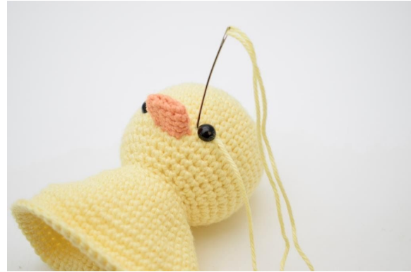
2. Stick ner nålen på vänster sida om ögat.