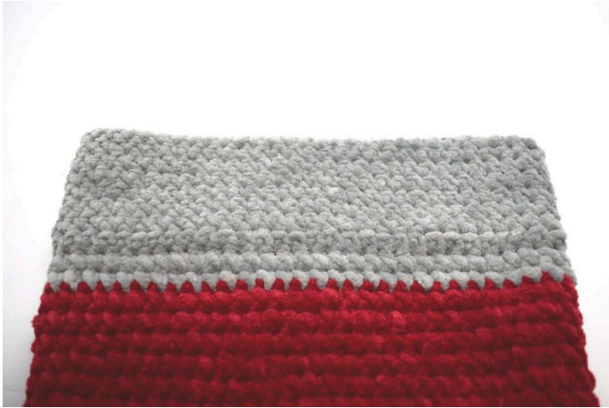
Kanten är nu färdigvirkad.