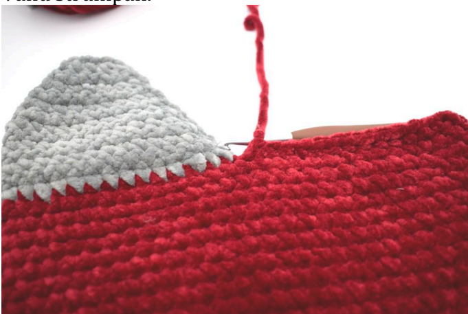
Virka 1 fm i 32 m fram till hälsens början.