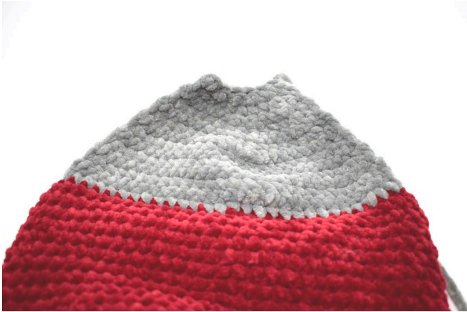
Så här ser hälen ut.