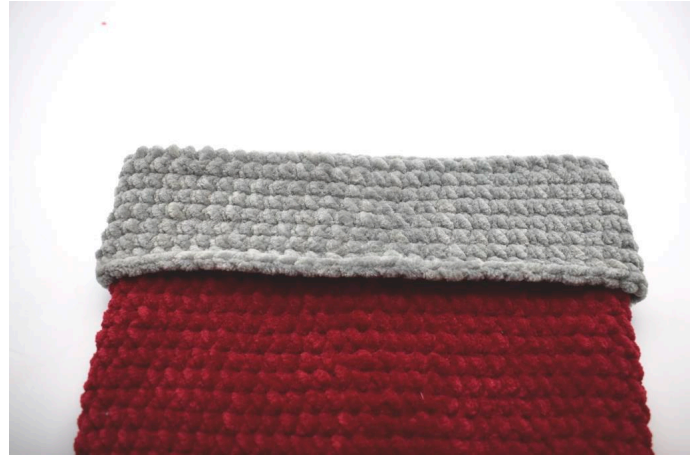
Vik ner kanten över strumpan.