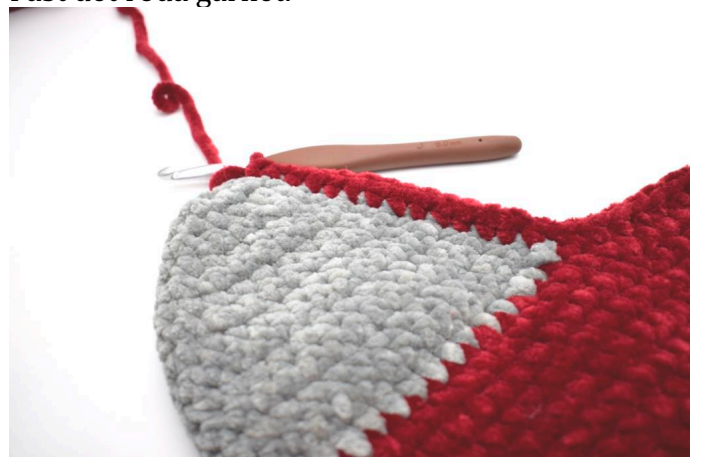
Virka nu 14 fm längs med ena sidan hälen