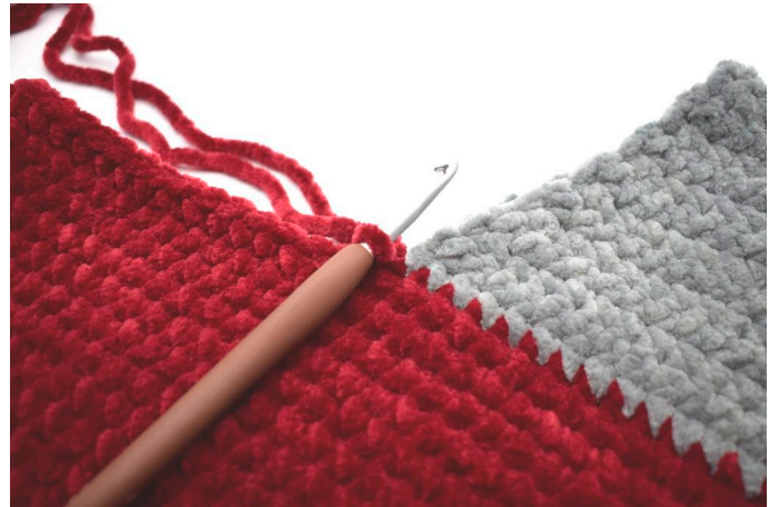
Fäst det röda garnet.