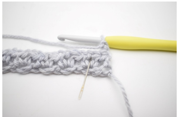
2. "Virka 1 hst, 1 lm och 1 hst i lm-båge från föregående varv". Nålen ovan visar vilken lm-båge du ska virka i.