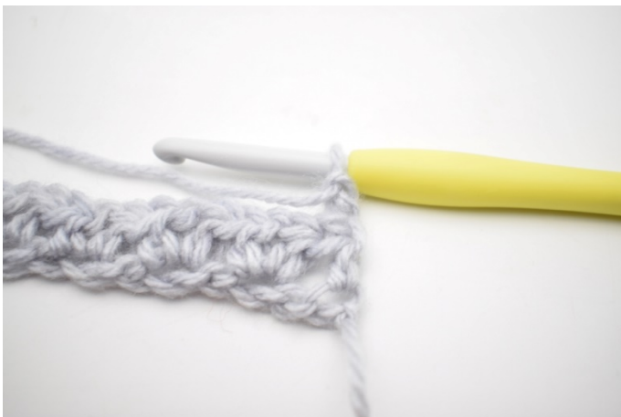
1. Vänd arbetet med 2 lm.