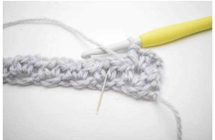
4. "Virka 1 hst, 1 lm och 1 hst i n  sta lm-b  ge."