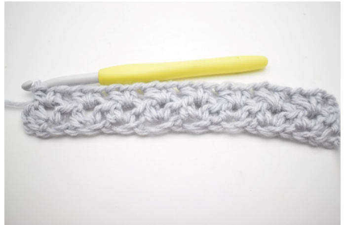
6. Upprepa " - " varvet ut.