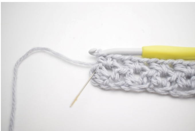
7. Virka 1 hst i sista m.