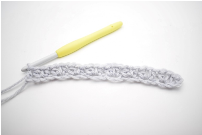
11. Nu är första varvet klart.