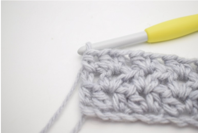
5. Så här.