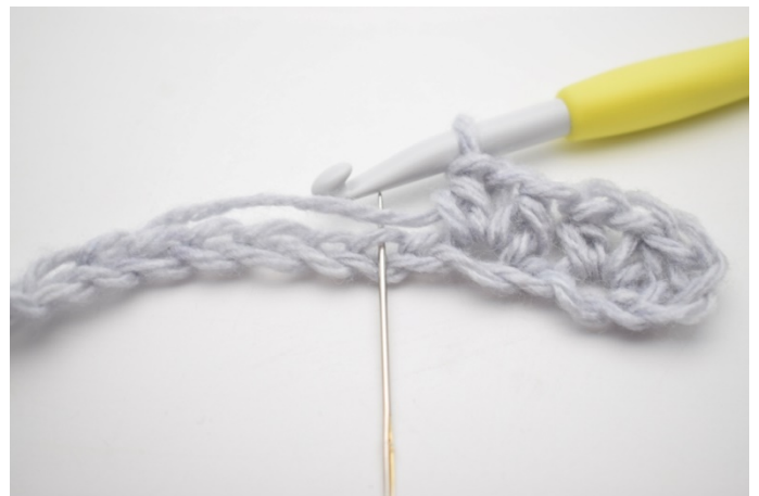
6. Hoppa 1 lm.