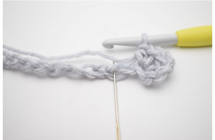
4. Hoppa 1 lm.