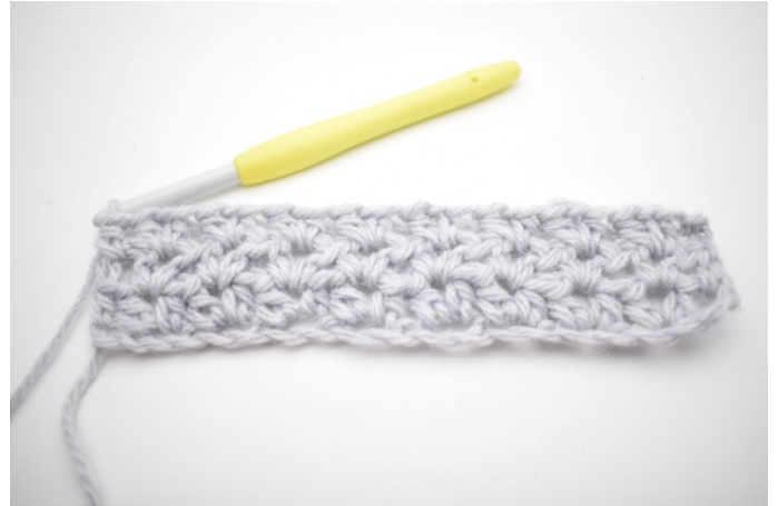
6. Nu är tredje varvet klart.