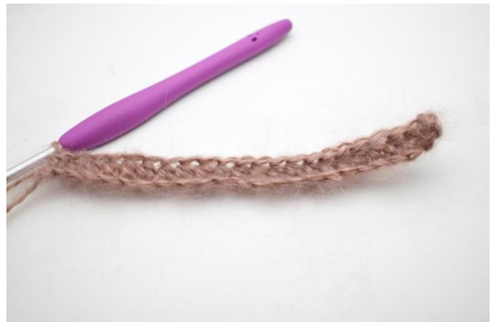
4. Virka hst varvet ut = 29(33) m.