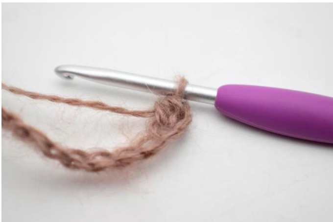
3. Så här.