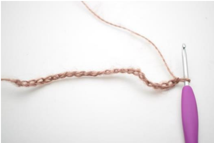
1. Lägg upp 30(34) lm.