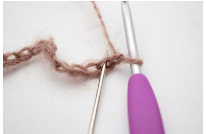
2. Virka 1 hst i 2.a lm från virknålen.