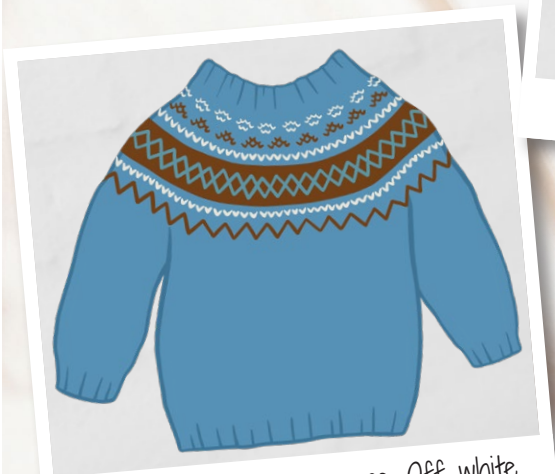
Jeans blue, Autumn orange, Off-white

Go handmade kvalitetsdesign i en unik stil