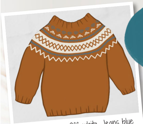
Autumn orange, Off-white, Jeans blue