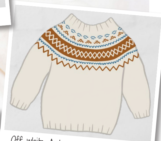
Off-white, Autumn orange, Jeans blue