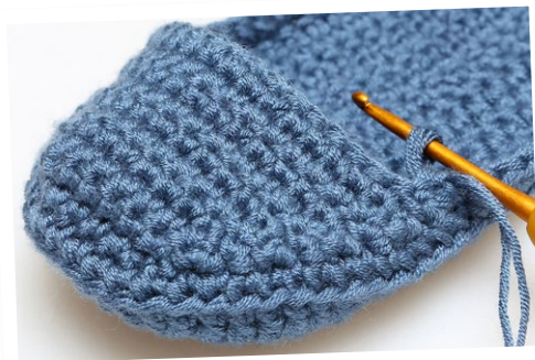
Här börjar på 10:e v av Överdelen.