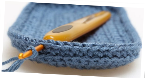
Här börjar Överdelen.