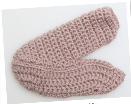
Den färdiga Överdelen på Sulan.