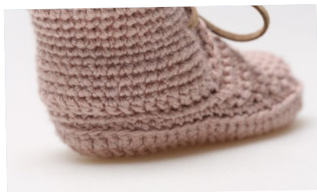
Hälkappan sys på Sulan.