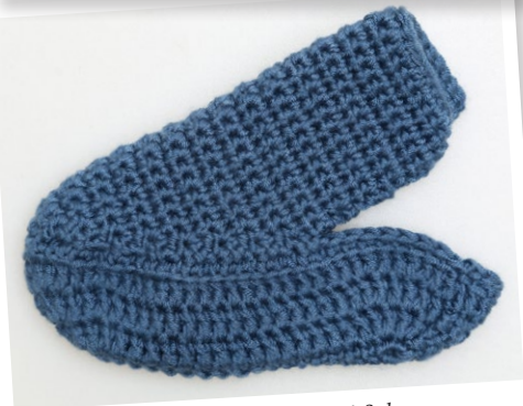
Den färdiga Överdelen på Sulan.