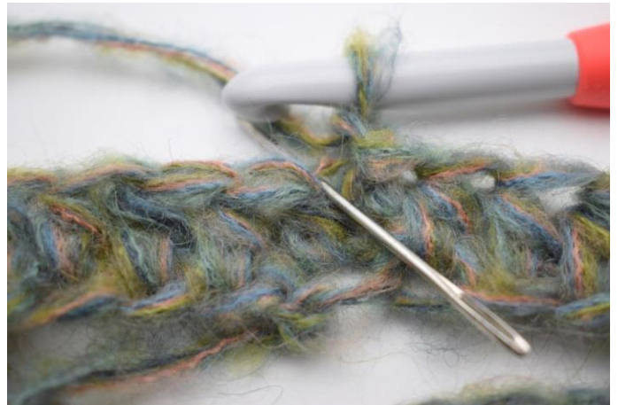
4. Virka hst i första maskas bmb. Nålen visar vilken maskbåge du ska virka i.