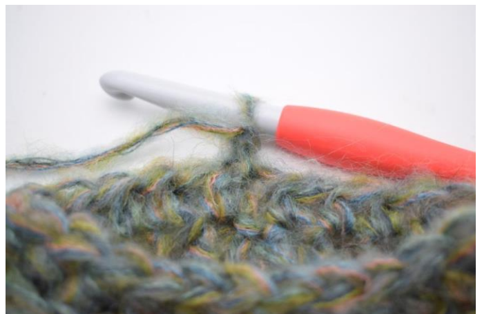
13. Vänd arbetet.