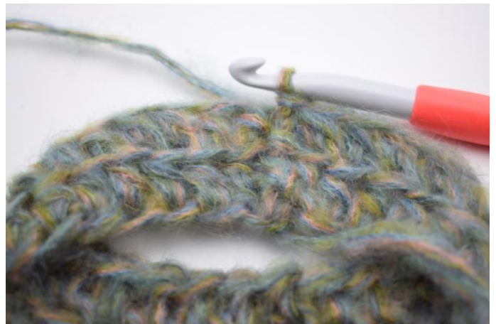
6. Virka hst i varje maskas bmb varvet runt. Avsluta med 1 sm i första hst. (58)