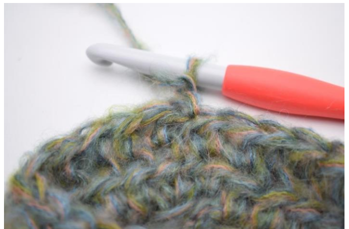
8. Vänd arbetet.