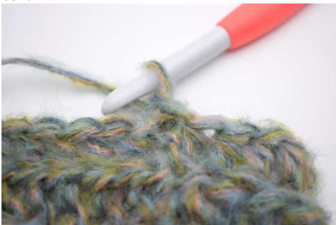
12. Virka på samma sätt som på varv 3. Virka 1 lm.