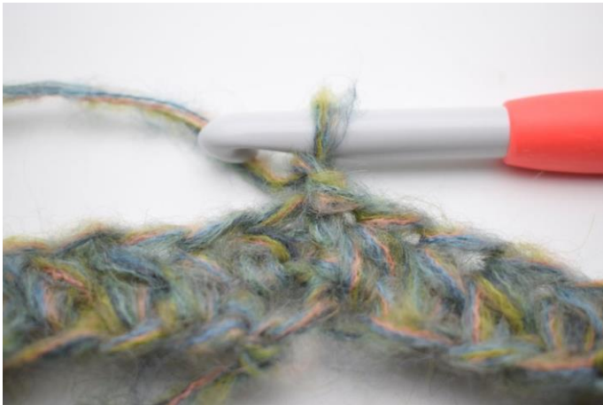
3. Virka 1 lm.