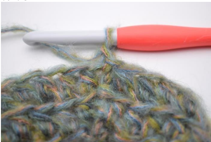
7. Virka 1 lm.