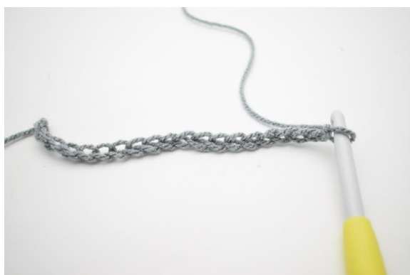
1. Lägg upp 196 lm.