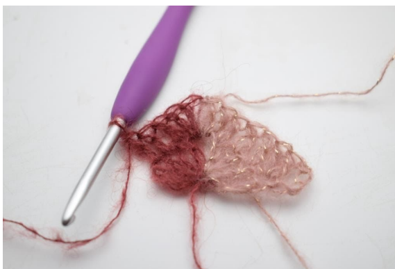
12. Virka 1 st i de nästa 3 m.