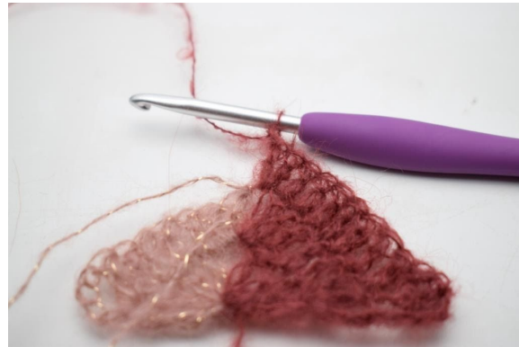
20. Så här.