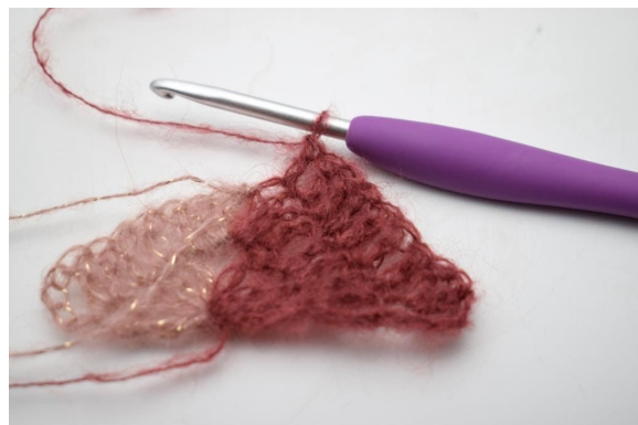
18. Virka 1 st i de nästa 7 m.