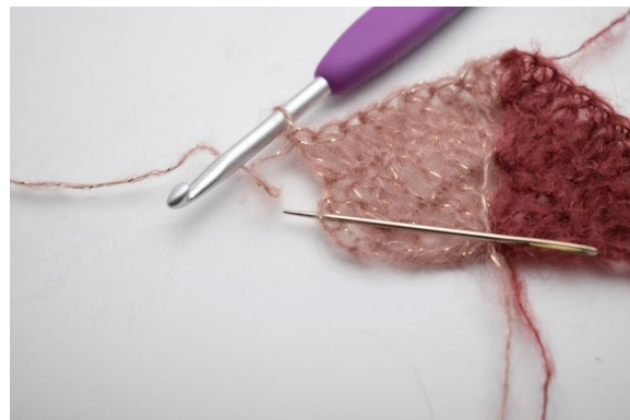
24. I sista m, virka 2 st och 1 dst.