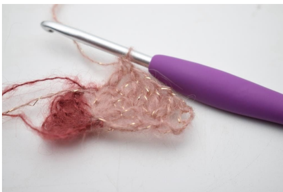
8. Virka 1 st i de nästa 3 m.