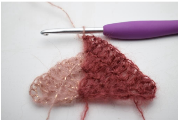
21. Byt till fg 2. Virka 1 lm, och virka ytterligare 2 st i lm-bågen.