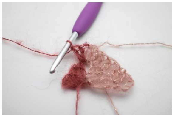
11. Byt till fg 1. Virka 1 lm, och virka ytterligare 2 st i lm-bågen.