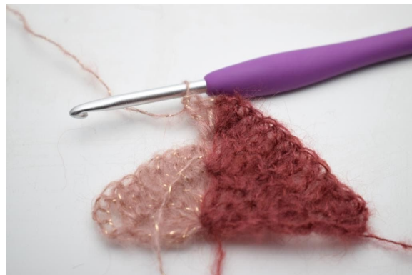
22. Så här.