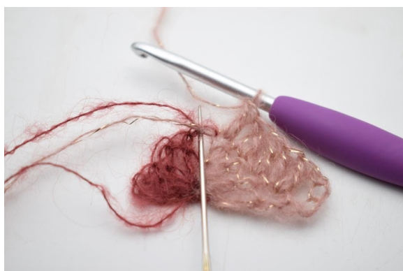
9. I lm-bågen, virka 2 st och 1 lm.