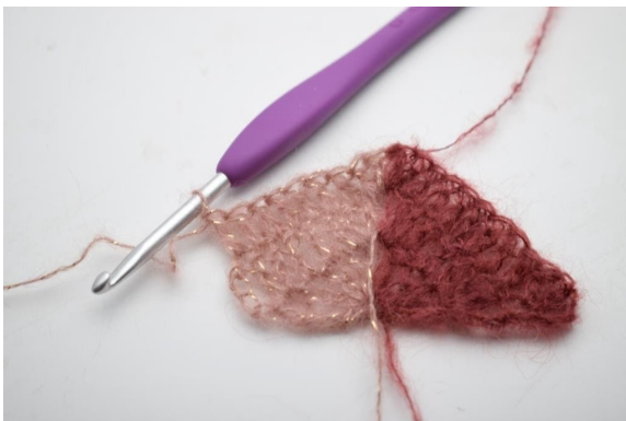
23. Virka 1 st i de nästa 7 m.