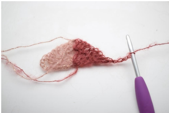
15. Vänd med 4 lm.