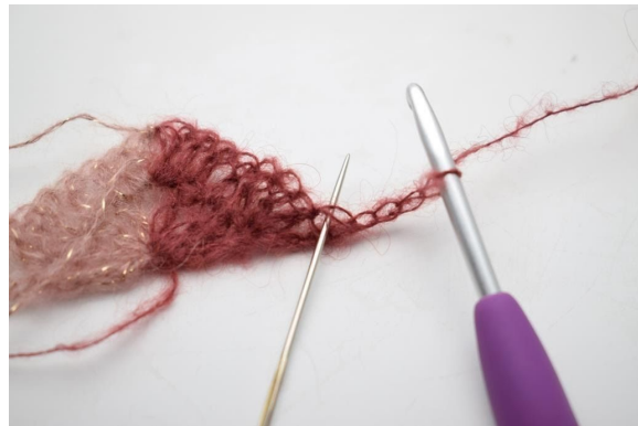
16. Virka 2 st i första m.