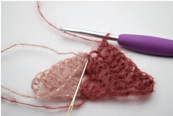
19. I lm-bågen, virka 2 st och 1 lm.