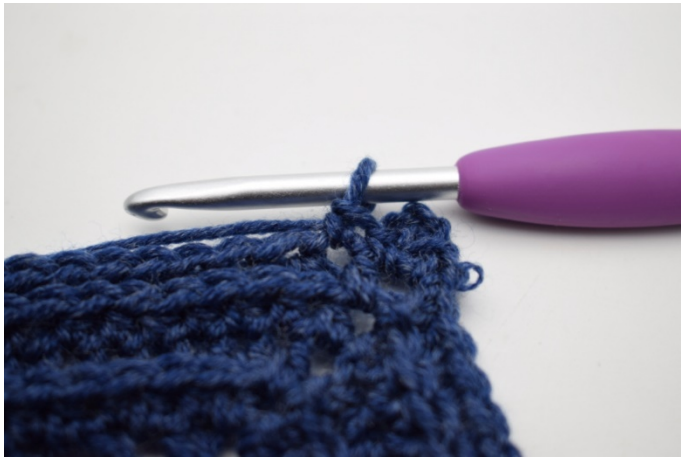
7. (Virka 1 fm i första m.