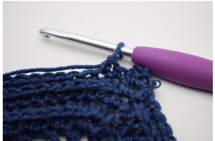
8. "Virka 1 fm i nästa m.