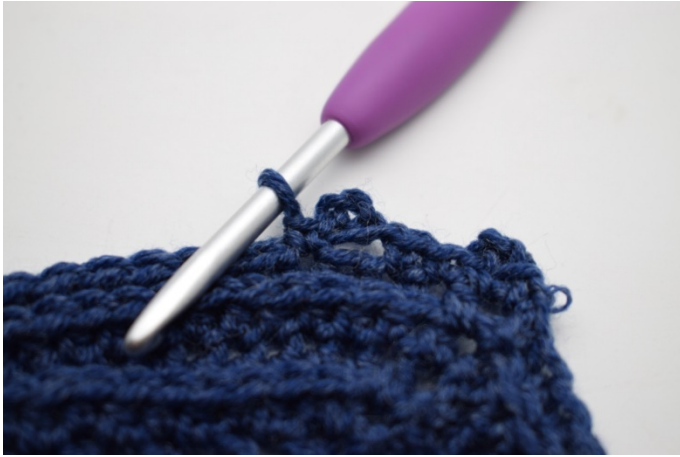
13. Så här.