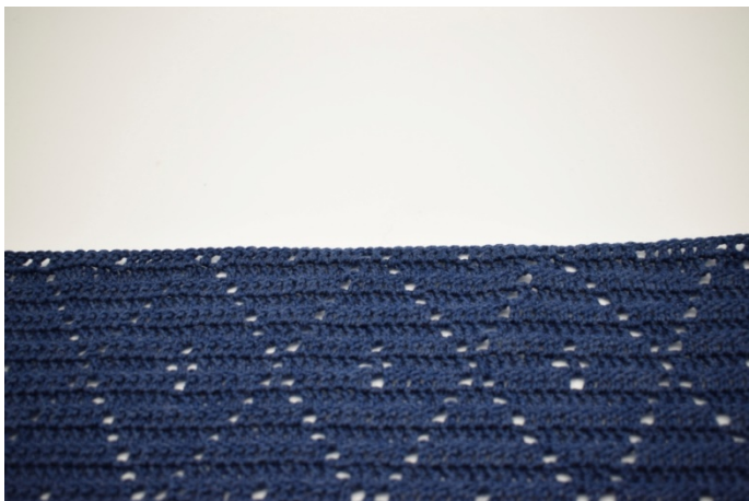
1. Filten är klar och nu ska kanten virkas på.