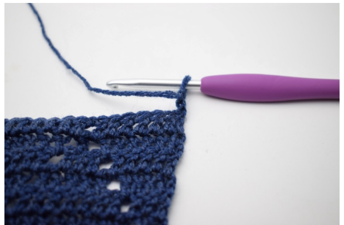
2. Vänd med 3 lm.