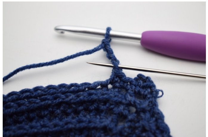
10. Virka 1 sm i 1:e lm.