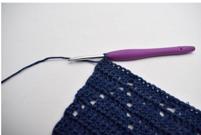
3. Virka 1 hst i de 159 m.