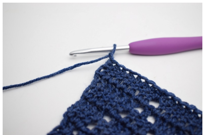
4. Virka 2 lm.