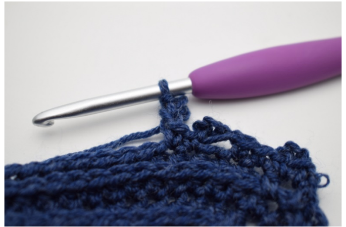
16. Virka 1 sm i 1:e lm.