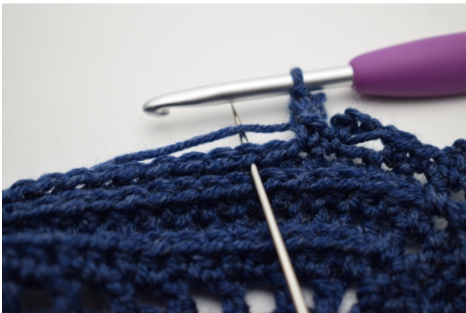
17. Hoppa över 1 m och virka 1 fm i nästa m".