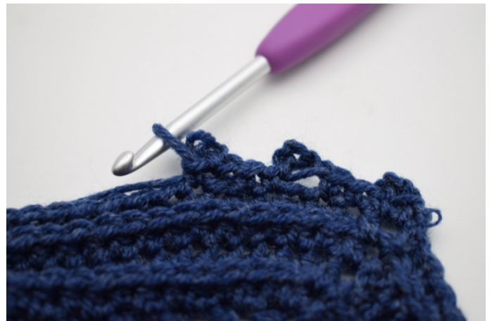
18. Så här.