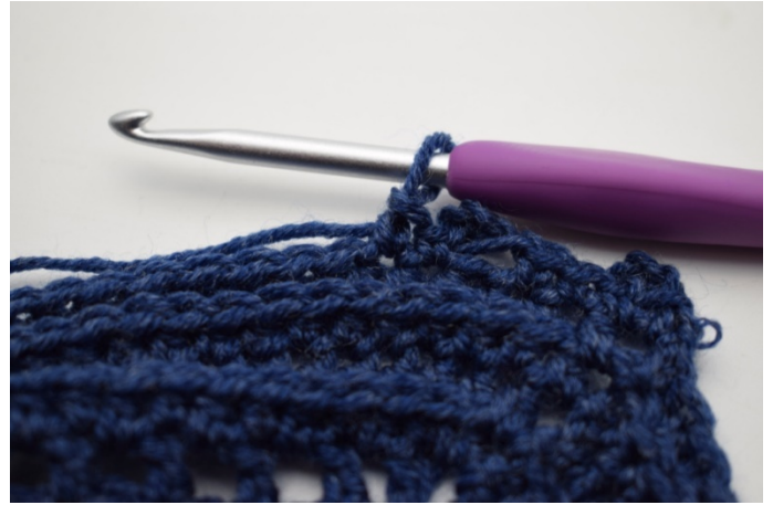
14. "Virka 1 fm i nästa m.