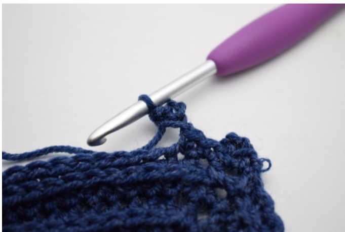
11. Så här.