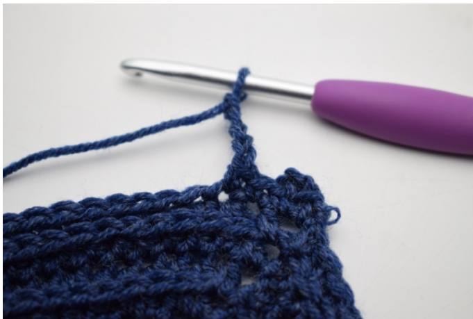
9. Virka 4 lm.