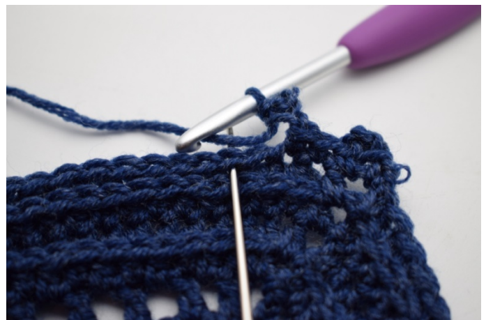
12. Hoppa över 1 m och virka 1 fm i nästa m".