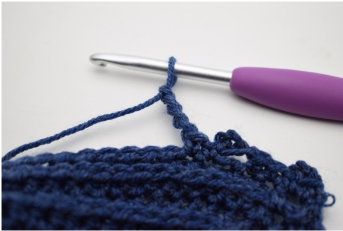
15. Virka 4 lm.