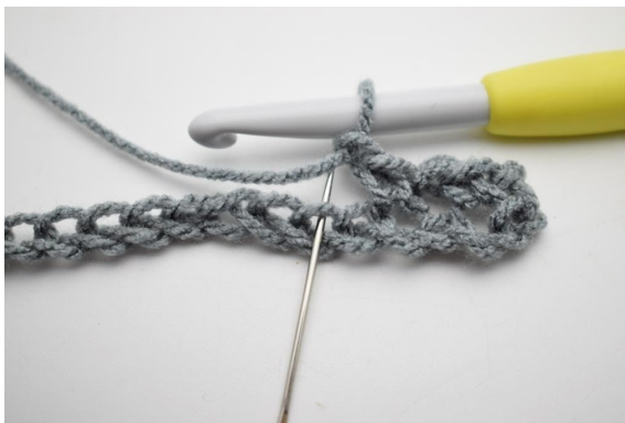
6. "Virka 1 lm, hoppa 1 lm och virka 1 fm i nästa m".