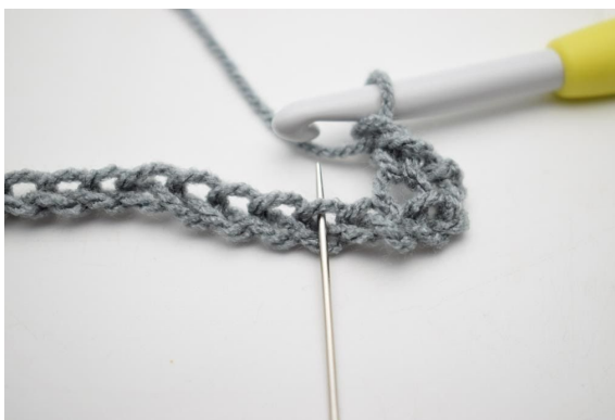
4. ”Virka 1 lm, hoppa 1 lm och virka 1 fm i nästa m”.