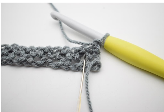
2. Virka 1 fm i första lm-mellanrum.