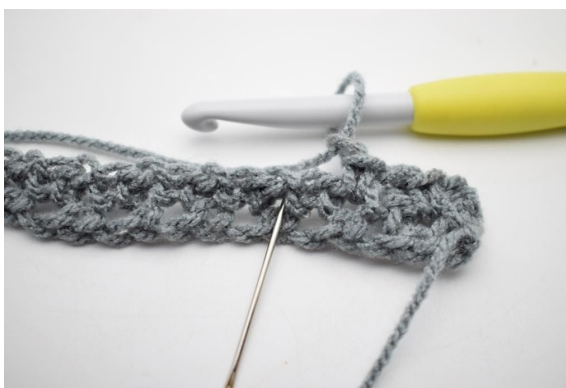
6. "Virka 1 fm och virka 1 fm i nästa 1m-mellanrum".