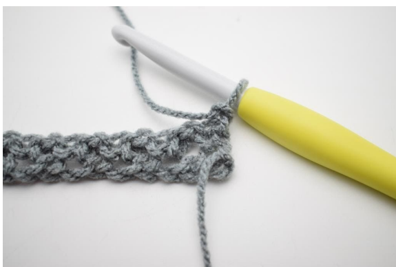
1. Vänd med 2 lm.