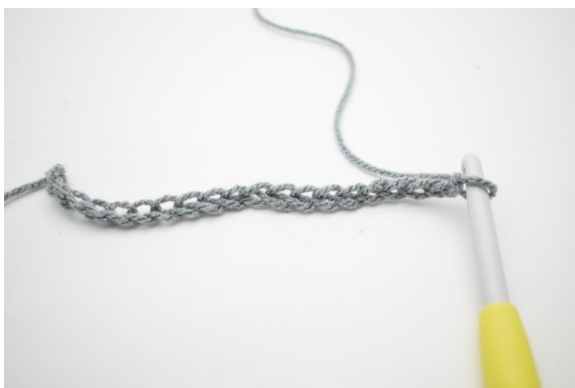
1. Lägg upp 232 lm.