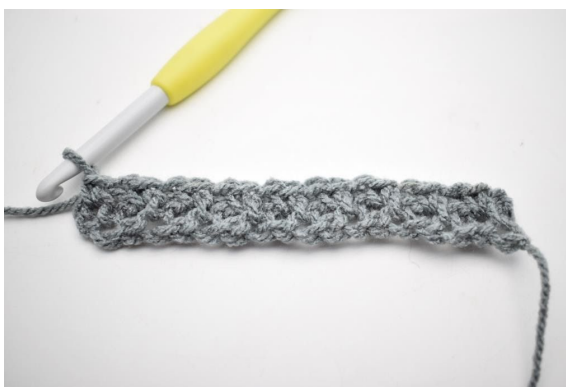
8. Upprepa "-" varvet ut.