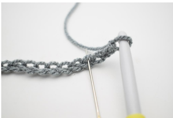
2. Virka 1 fm i 4:lm från nålen.