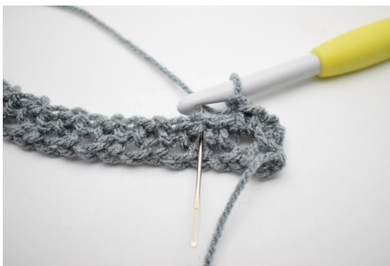
4. "Virka 1 fm och virka 1 fm i nästa 1m-mellanrum".