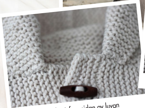
Omvik på framsidan av luvan