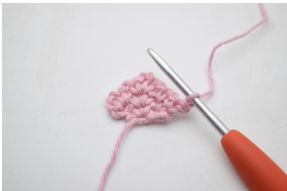
1. Vänd med 1 lm.