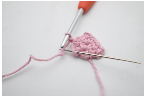
14. Virka 1 fm i sista m.