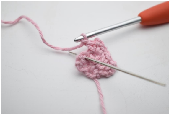
11. Virka 1 fm i lm-bågen från föregående varv.