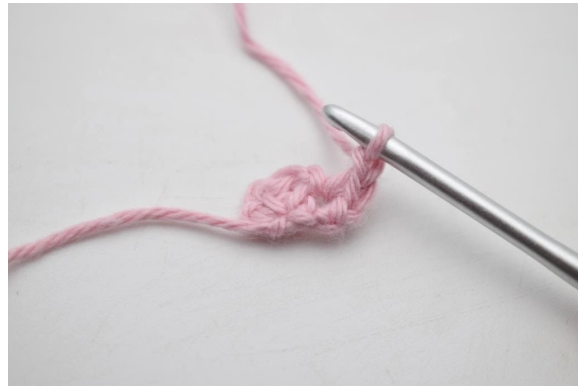
4. Virka 1 lm.