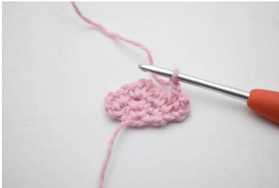
7. Virka 1 lm.