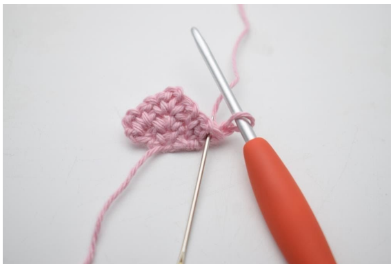
2. Virka 1 fm i första m.