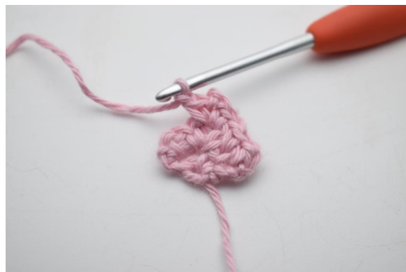
10. Virka 1 lm.