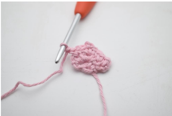
13. Virka 1 lm.