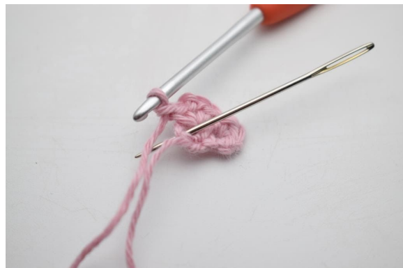
8. Virka 1 fm i sista m.