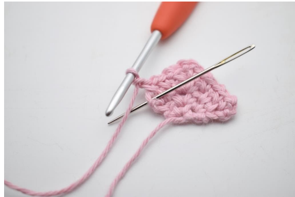
20. Virka 1 fm i sista m.