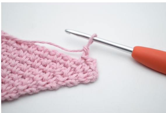
8. "Virka 2 lm.