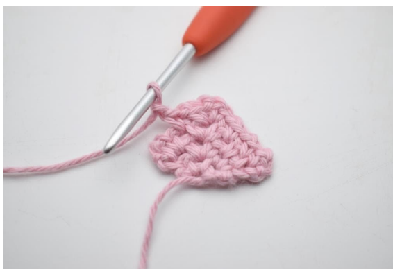
16. Virka 1 lm.