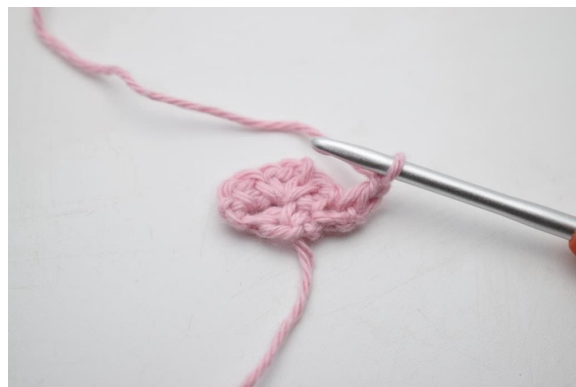
4. Virka 1 lm.