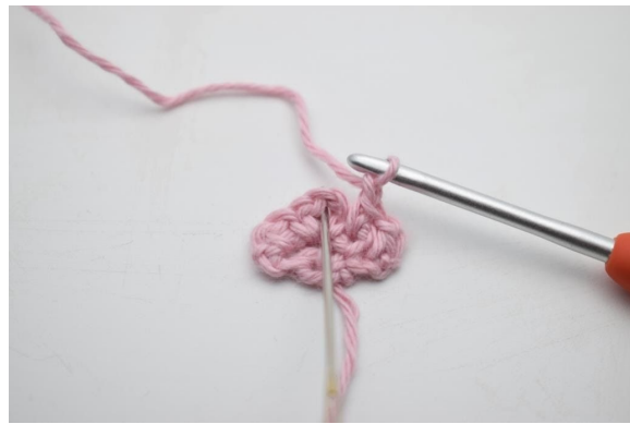
8. I lm-bågen från föregående varv, virka 1 fm, 2 lm och 1 fm.