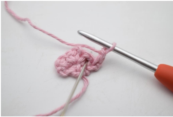
5. Virka 1 fm i lm-bågen från föregående varv.