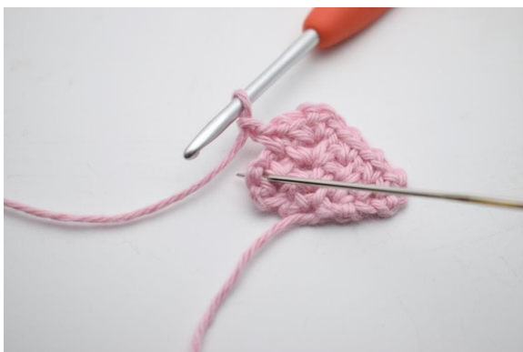
17. Virka 1 fm i nästa lm-båge från föregående varv.