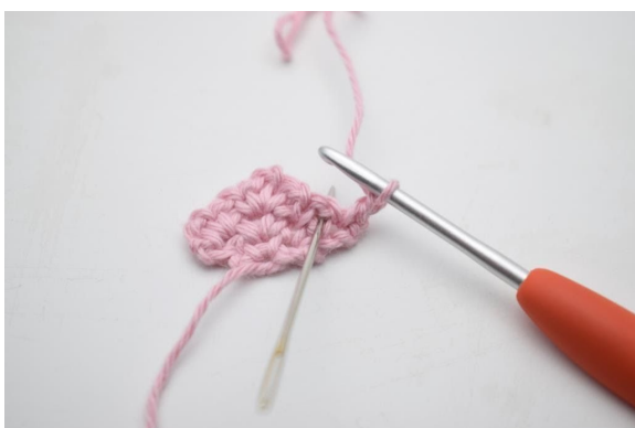
5. Virka 1 fm i lm-bågen från föregående varv.