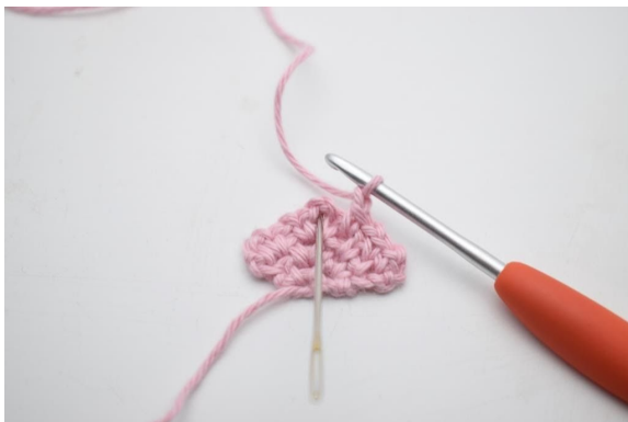
11. I lm-bågen från föregående varv, virka 1 fm, 2 lm och 1 fm.