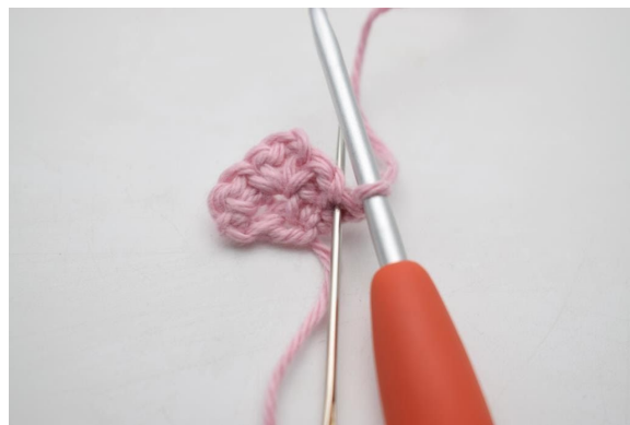
2. Virka 1 fm i första m.