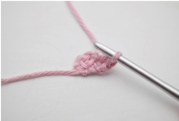
3. Så här.