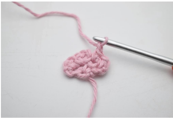
7. Virka 1 lm.