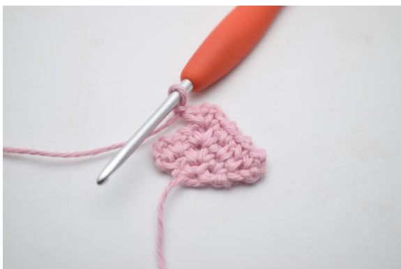
13. Virka 1 lm.