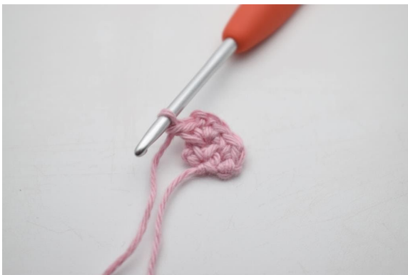
7. Virka 1 lm.