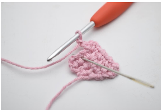
14. Virka 1 fm i lm-bågen från föregående varv.