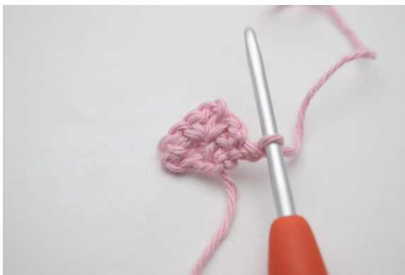
1. Vänd med 1 lm.