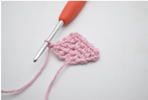
19. Virka 1 lm.