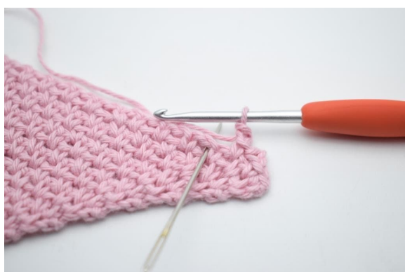
11. Hoppa 1 m och virka 1 fm i nästa lm-båge.