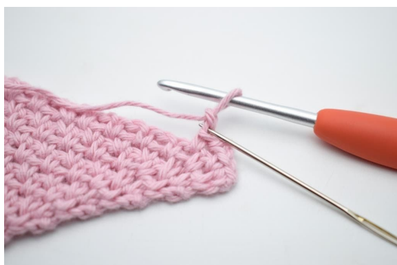
9. Virka 1 sm i 2:e lm från nålen.