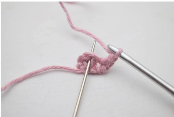
5. I lm-bågen från föregående varv, virka 1 fm, 2 lm och 1 fm.