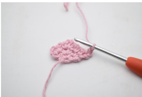
4. Virka 1 lm.