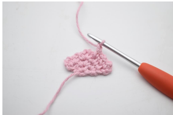
10. Virka 1 lm.