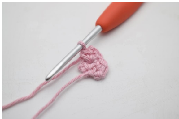
6. Så här. Detta är haklappens topp.