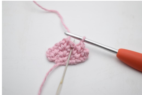
8. Virka 1 fm i nästa lm-båge från föregående varv.