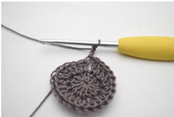
1. Virka spiral. "Virka 2 lm.