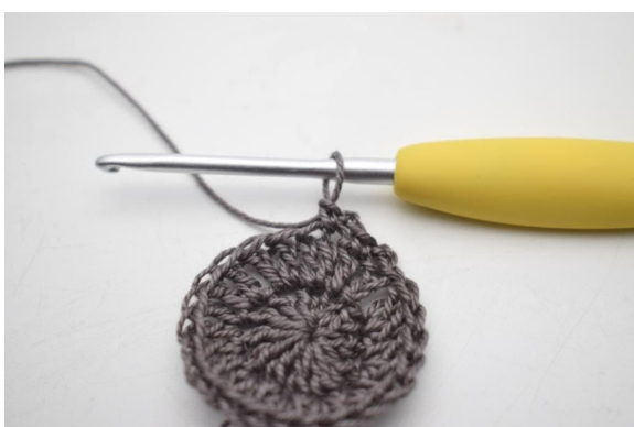
5. Så här.