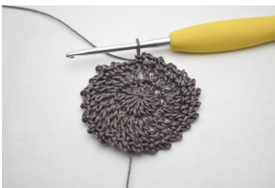
6. Upprepa "-" varvet runt. (24 lm-bågar)