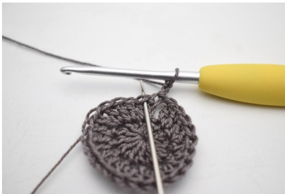
2. Virka 1 fm i nästa m".