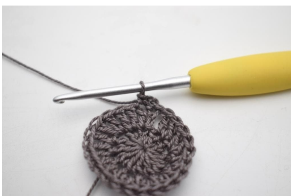
3. Så här.