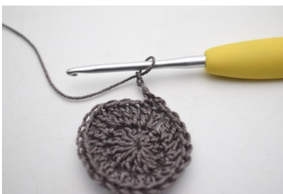
4. "Virka 2 lm och virka 1 fm i nästa m".