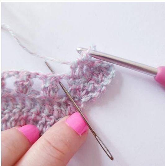
2 st i lm-hålet, 1 st i nästa st, upprepa till toppen | I toppen: [2 st, 2 lm, 2 st]