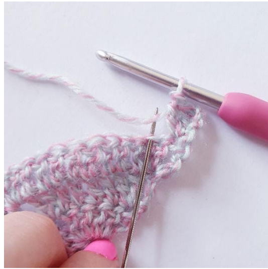
1 st i nästa m