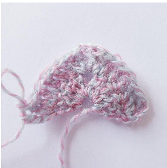
Efter varv 2