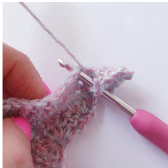
3-st-puff [omslag, nedtag i maskan,