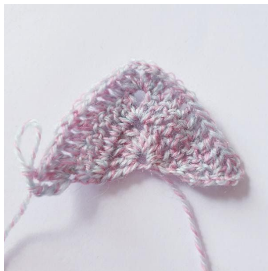
Efter varv 3