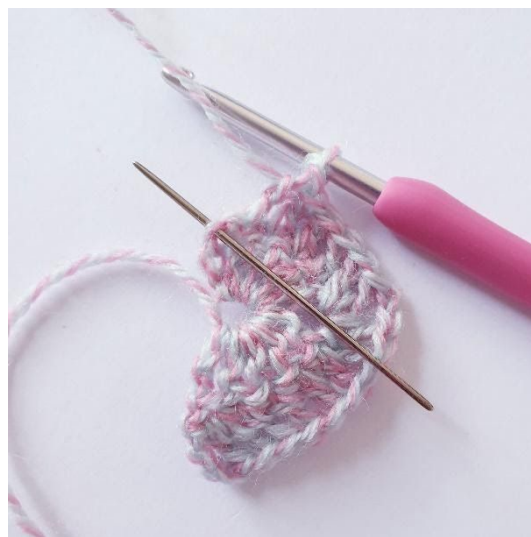
[2 st, 1 dst] i vlm.