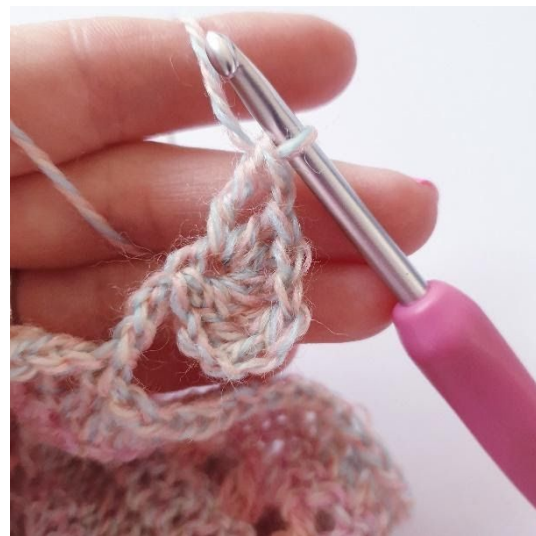
1 lm, 1 dst,