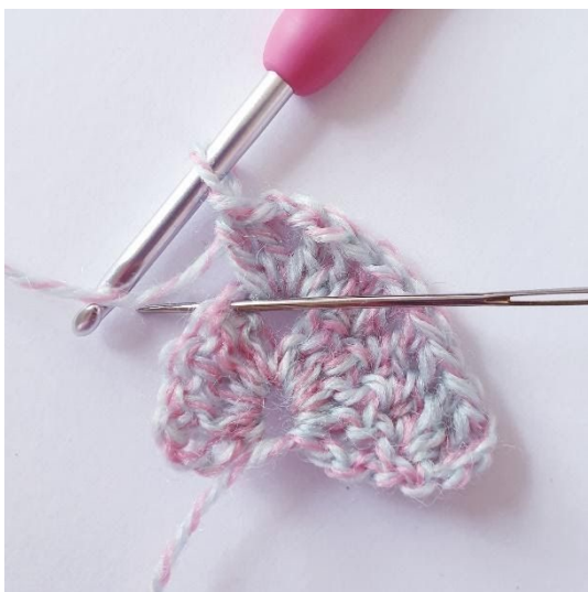
1 st i de nästa 4 m