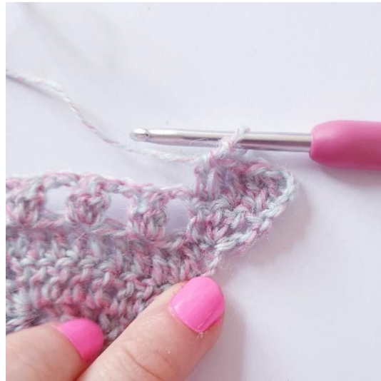
1 st i de nästa 3 m