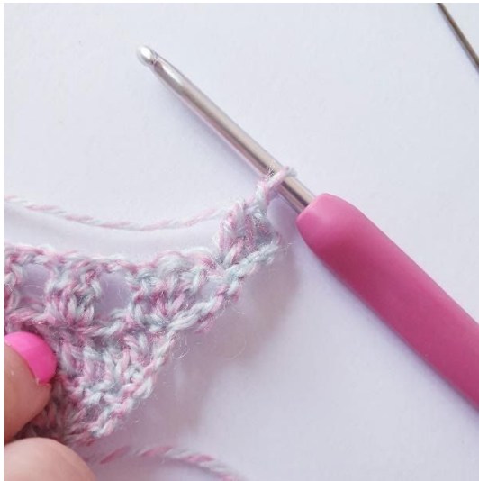
2 st i första m