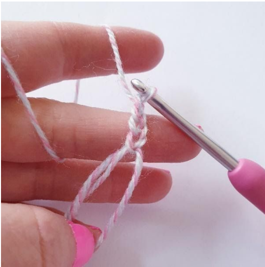
Varv 1: 4 lm