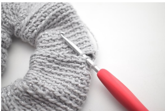
11. Virka ihop tuben med sm genom bmb och uppläggningkantens m.