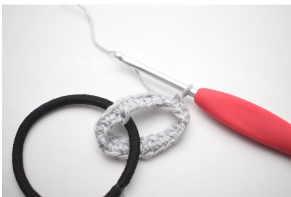
3. Virka 1 lm och virka fm varvet runt. Avsluta med 1 sm i första fm. (20)