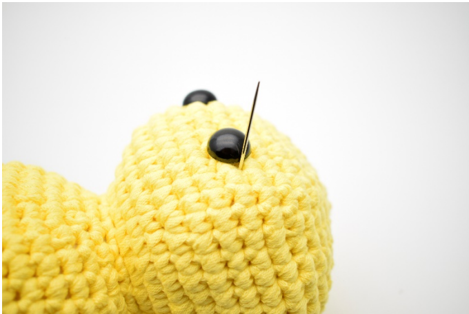
1. Med gult garn stick ner nålen genom huvudet och ut på ena sidan ögat.

Gör ev. fördjupningar vid ögonen på detta viset: