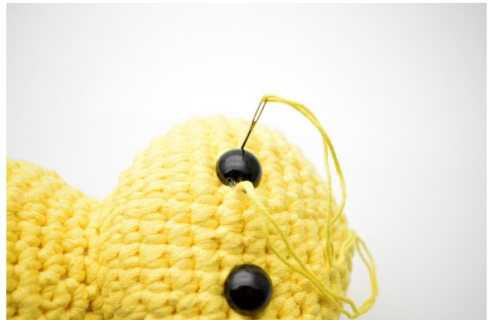
4. och ner igen på andra sidan ögat.