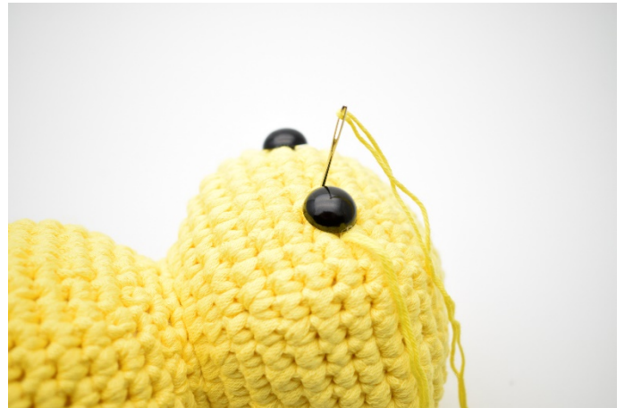
2. Stick ner nålen på andra sidan ögat och dra åt lite lätt.