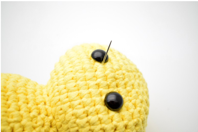
3. Dra upp nålen på ena sidan av andra ögat.