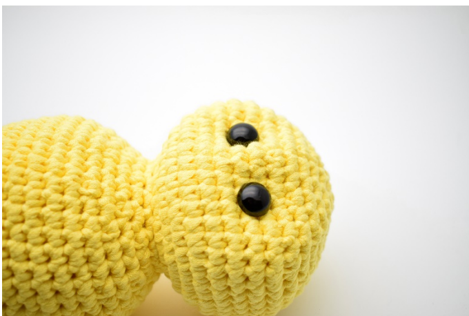
5. Dra åt lite lätt för att bilda fördjupningarna.